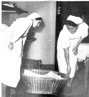
Ein kleines Detail: Wie man Türen ohne Geräusch öffnet.