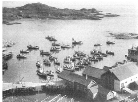
Das erste Drittel des Jahres ist die beste Zeit für den Dorschfang. Gleich nach Neujahr strömen von der ganzen norwegischen Küste die Fischkutter in die kleinen Häfen auf den Lofoten und warten auf die Meldung der Dorschzüge. Ende April verschwinden diese Kutter alle wieder.