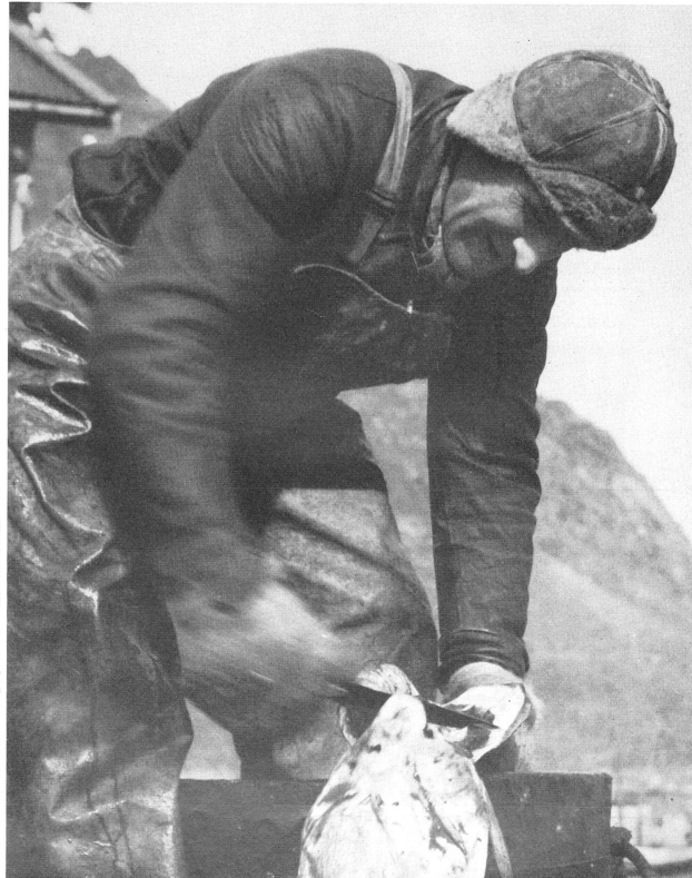
Ein Lofotfischer arbeitet täglich viele Stunden am Schlachtbottich. Die Lebern werden in einen gesonderten Bottich gelegt und in die Lebertranfabrik gebracht; dort werden sie gedämpft und dann ausgepresst. Das goldgelbe Öl fliesst aus der Presse wie bei uns der Most aus der Apfelpresse. Indessen weicht ein Unterschied des Geruchs!