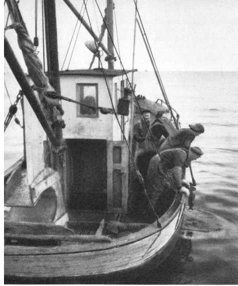
Die Mannschaft eines norwegischen Fischkutters besteht aus drei bis vier Mann. Diese leben oft während vieler Wochen auf dem kleinen Boot. Bei Morgengrauen fahren sie aus zum Fang, zerlegen abends die Beute und bringen den Ertrag entweder dem Fischhändler oder in die Lebertranfabrik. Abends säubern sie noch die Leinen und Netze und legen alles für den nächsten Tag bereit. Ein hartes Tagewerk!

In den Häfen der Lofotendörfer herrscht während des Dorschfangs reger Betrieb. Der Lofotfang ist uralte. Schon zur Zeit der Wikinger waren diese Fischbänke bekannt.