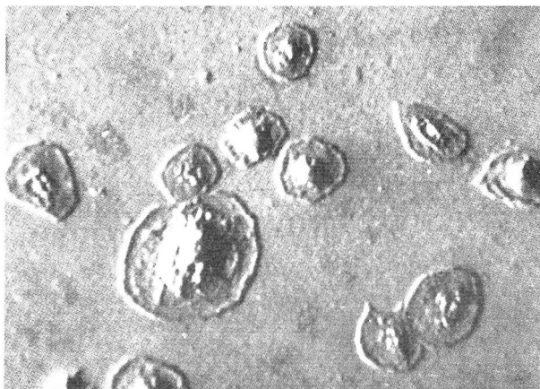
Ungefärbte, einzeln liegende Blutplättchen in einer Phasenkontrast-Aufnahme.

Der Vorgang der Blutgerinnung wird durch Verklebung und Zerfall der Blutplättchen eingeleitet. Innerhalb der Blutbahn tritt normalerweise keine Gerinnung ein, da die Plättchen an den äusserst glatten Gefässwänden nicht haften können und vom Blutstrom dauernd durchmischert werden. Bei Verlangsamung des Blutkreislaufes infolge Blutstauung, bei Erkrankungen der Gefässe mit Aufrauung der