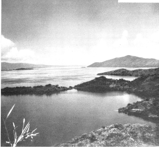
Mitten im Vulkangebiet des Kivus Im Vordergrund die typische Lavavegetation.