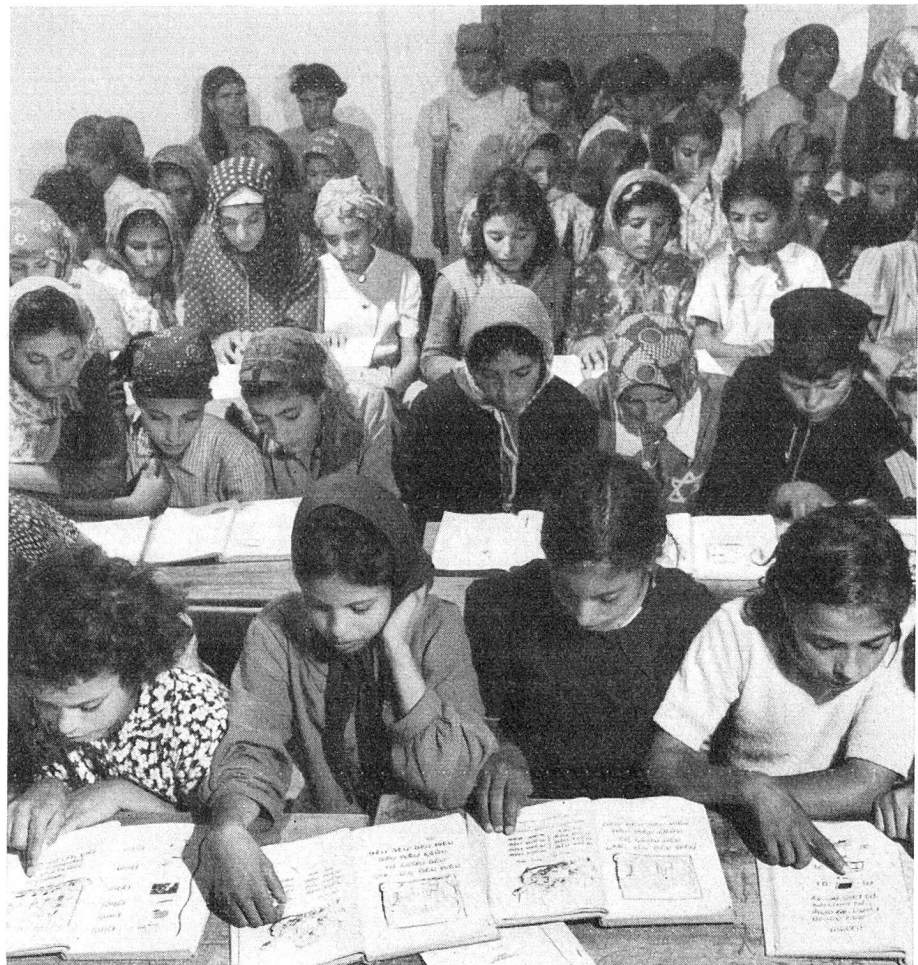
Schulpflichtige Kinder jeden Alters lernen die hebräische Sprache als Umgangssprache. Mädchen und Knaben werden getrennt unterrichtet.

Gibt es nicht zu denken, dass gerade den Frauen der Brauch obliegt, die Sabbathlichter anzuzünden und zu hüten? Eigentlich sollte der Sabbath licht- und feuerlos begangen werden; das Verbot des