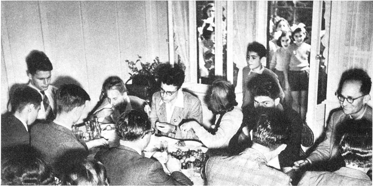
Während des verspäteten Mittagessens im Präventorium Beau-Soleil in Gstaad — der Autocar war dort erst um 14 Uhr angekommen — unterhielten die kleinen Griechinnen und Griechen die jugendlichen Gäste mit Liedern und Balladen ihrer griechischen Heimat.