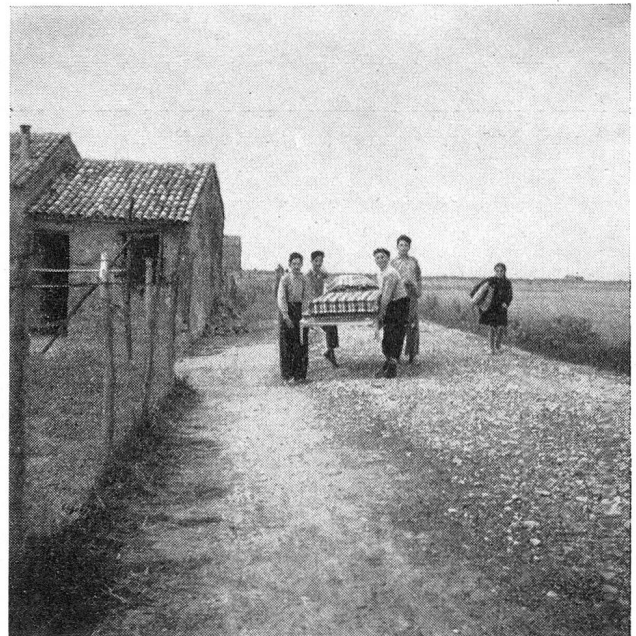
Bild Mitte rechts. Ein von der Schweizer Bevölkerung durch die Vermittlung ihres nationalen Roten Kreuzes gespendetes Bett wird in ein Haus getragen. Diese Gabe ist überall hochwillkommen.

Bild rechts unten. Eine Familie besichtigt die neuen Betten. «Solch gute Matratzen!» — «Diese weichen Wolldecken!» — «Dazu noch Küchengeräte!» — «Jetzt sollten unsere Felder noch bebaubar sein! Die Versendung ist ein Unglück!»