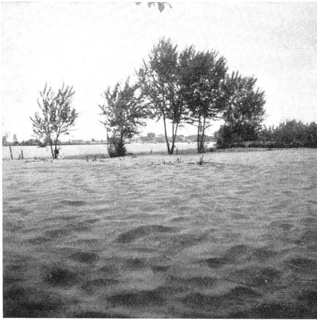
Bild oben. In der Umgebung von Contarina im Po-Delta finden wir zahlreiche Felder mit einer Schicht von 70 cm bis 1 m Sand bedeckt. Versuche, diese Sandwüsten anzupflanzen — die Bewohner dieser Gegend dachten an den fruchtbaren Schlamm, den der Nil jährlich über die Felder schüttet — scheiterten gänzlich. Nichts, rein gar nichts vermochte auf dieser Wüste zu gedeihen. Die riesigen Mengen von Sand müssen mühsam abgetragen werden. Eine beschwerliche Arbeit auf lange Sicht!

Bild unten. Andere Felder sind von einer verkrusteten, grünlichen und übelriechenden Schlammschicht bedeckt, die ebenfalls kein Wachstum zulässt. Tiefes Umpflügen wird vielleicht die Lage retten.