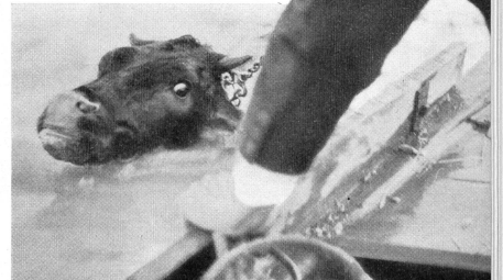
Bild rechts: Eine von der Strömung erfasste Kuh wurde ins Schlepptau einer Barke genommen und gerettet. Tausende und Tausende von Haustieren ertranken.

Bild links: Eine Gruppe von Flüchtlingen beim Eintreffen in einem wassersicheren Dorf. Sie alle konnten nur das Nützlichste mitnehmen. Angst, Schrecken und Not der letzten Stunden haben ihre Züge gezeichnet. Nur das Kleinkind vermag noch nicht zu erlassen, welches Unglück sich über seine Familie, sein Dorf, seine Gegend gestürzt hat.