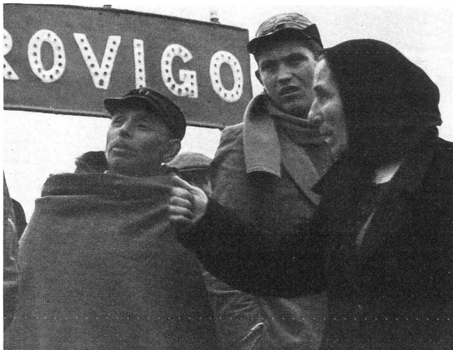
Nach anstrengender nächtlicher Flucht waren diese vom Wasser Ueberraschten in Rovigo eingetroffen, von wo sie aber weiter nach Padua flüchten mussten, da auch Rovigo gefährdet war.

Unseren Plan, 2000 komplette Betten für die Wassergeschädigten zu senden, wurde von Präfekt Rizza mit grosser Freude aufgenommen; diese Sendung werde eine wirkungsvolle Hilfe darstellen. Auch er bat im weiteren um Küchengeräte; vor allem um Pfannen und Kochkessel für offene Feuer. Diese würden bestimmt überall dort fehlen, wo die