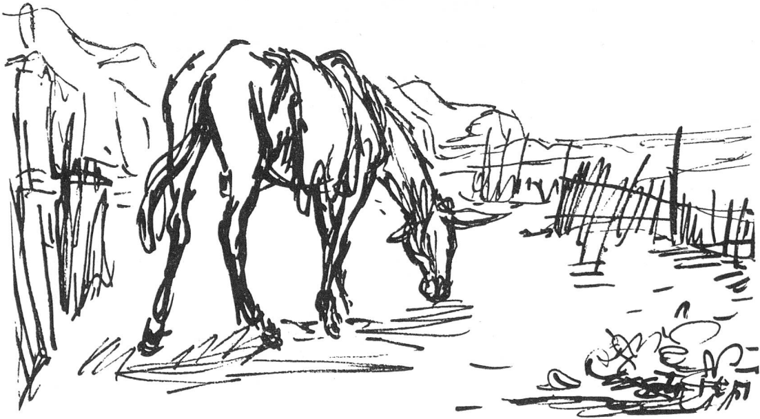
Südtalien. Maultier am Meer. Studie von Ignaz Epper, Ascona.

Einrichtung von den einstürzenden Häusern erdrückt oder die Küchen von den Fluten ausgespült worden waren. Für die Frage der zu schenkenden Kühe ist Präfekt Rizza nicht zuständig; sie wird mit dem Landwirtschaftsministerium in Rom abgeklärt werden müssen.