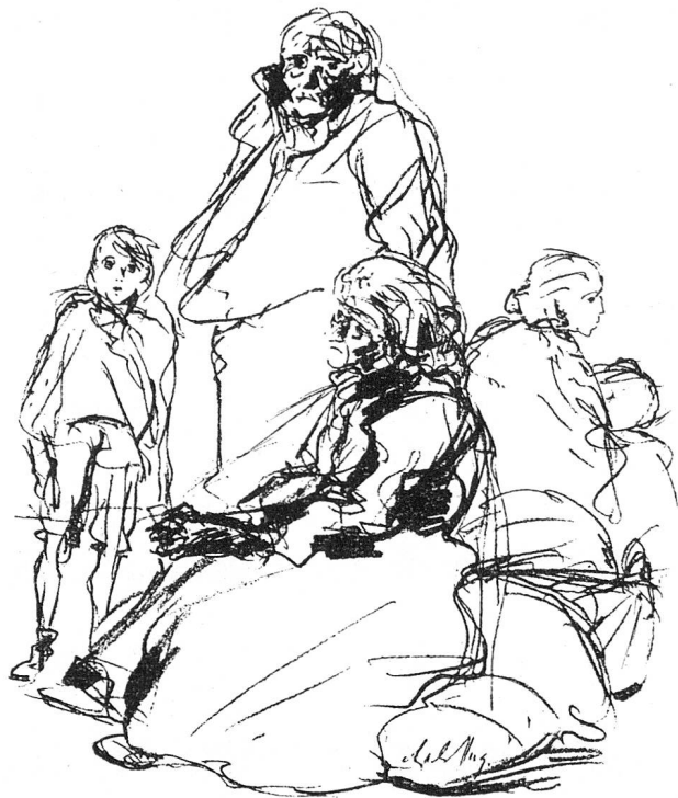
Obdachlose. Federzeichnung von Charles Hug, Zürich.

gebracht sind. In diesen Baracken leben je zwei Familien in einem Raum. Dort herrscht tadellose Ordnung und Sauberkeit. Welch grosse Zahl von Kindern! Sie tragen ein leichtes Kleidchen, die Buben ein Paar dünne Hosen, ein zerschlissenes Leibchen, darunter nichts. Fast alle sind erkältet und sehen blass und kränklich aus. Die Inspektorin regte an, statt der versprochenen Pulvermilch, die hier wenig geschätzt wird, ein Kindermehl für die Kleinkinder zu senden. Ganz dringend werde