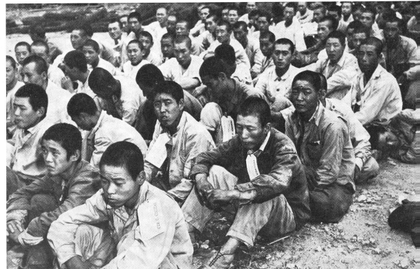
Northkoreanische Kriegsgefangene warten auf den Abtransport in ein Lager.