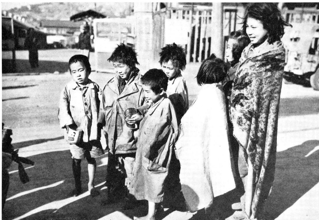
Waisenkinder in Söul, die in den Strassen jener halbzerstörten Stadt die Vorübergehenden um Nahrung bitten. Foto Ronald L. Hancock, USA-Armee.

Das Gelände ist mit Wirtschaftsgebäuden, Schulhäusern, einer Dampfküche, einem Badehaus mit Brausen, Waschküchen und Spitalgebäuden mit Bestrahlungs- und Operations- sowie Isolierungsräu-