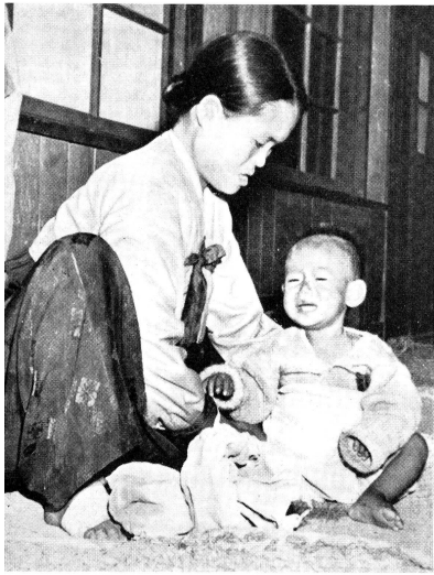
Dieses kleine Kind, das im zartesten Alter durch die Kriegshandlungen Waise geworden ist, blieb der Obhut eines Schwesters überlassen, das selbst viel zu klein war, um die schweren Sorgen der Nahrungsbeschaffung tragen zu können. Jetzt trägt das Waisenhaus diese Sorgen.