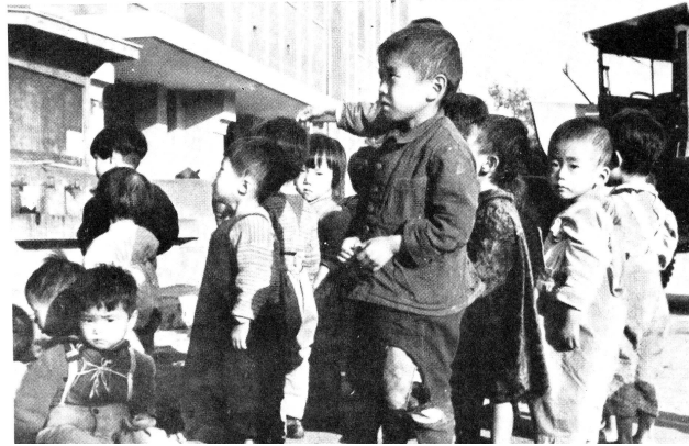
Wiederum ist ein Camion vor den Toren des Waisenhauses vorgefahren, wiederum haben die Helfer des Koreanischen Roten Kreuzes die Kleinen, eines nach dem andern, herausgehoben und in die Arme der Rotkreuzhelferinnen gelegt, wiederum stehen die Kinder etwas verloren vor dem grossen Gebäude, das sie nun bald aufnehmen wird: ein Waisenhaus.