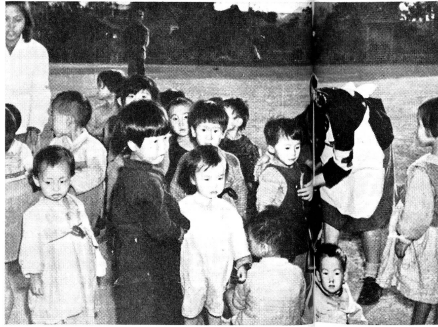
Der Anblick dieses Bildes muss jeder Mutter ins Herz schmerzen. Eine Gruppe verlassener Kleinkinder, kurz zuvor in den Strassen von Seoul gesammelt, jetzt vor den Toren des Waisenhauses stehend, alle müde, alle ohne Verständnis für das Geschehen, das ihnen Eltern und Heim geraubt hat.