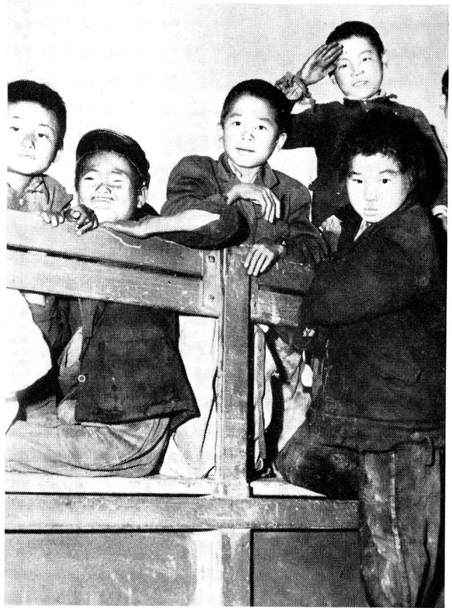
Die in den Strassen bettelnden heimatlosen und sich selbst überlassenen Kinder werden von Zeit zu Zeit gesammelt, auf Camions gehoben und in die überall eröffneten Waisenhäuser gebracht.

Sowohl während des Zweiten Weltkrieges als auch während der letzten Kriege in Palästina, Korea und Indochina hat die Zivilbevölkerung mehr und schwerer gelitten als die Armee. Der Hauptgrund bestand fast überall im Mangel an vorausschender Organisation, an ziviler Führung und an den Mitteln. Die Zivilbevölkerung sah sich im schlimmsten Augenblick ohne Leiter, ohne Organisation, ohne Befehl. Was nützt die militärische Verteidigung eines Landes, wenn die Zivilbevölkerung — und zwar in den meisten Fällen wegen des Fehlens von Zivilbehörden des eigenen Landes —