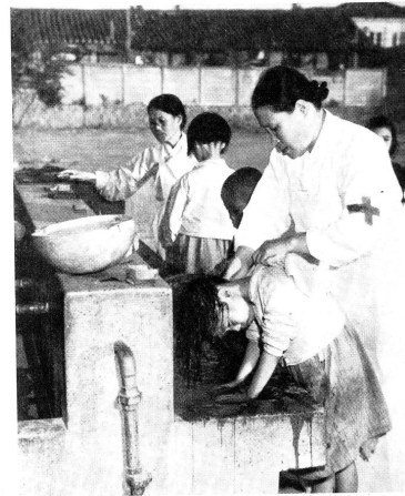
Die Kinder auf diesem Bilde sind soeben ins Waisenhaus gebracht worden. Sie werden dort vom Kopf bis zu den Füssen gewaschen, mit DDT besprengt und erhalten neue Kleider. Vor allem aber erhalten sie reichlich Nahrung, ein Bett und jene Geborgenheit, die einem so jungen Menschenkinde unerlässlich ist.