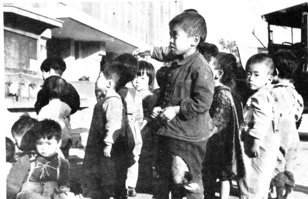
Wiederum ist ein Camion vor den Toren des Waisenhauses vorgefahren, wiederum haben die Helfer des Koreanischen Roten Kreuzes die Kleinen, eines nach dem andern, herausgehoben und in die Arme der Rotkreuzhelferinnen gelegt, wiederum stehen die Kinder etwas verloren vor dem grossen Gebäude, das sie nun bald aufnehmen wird: ein Waisenhaus.