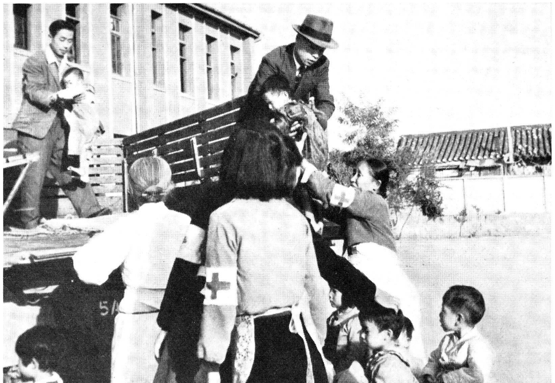
Unser Bild zeigt die Ankunft eines Camions mit Waisenkindern in einem Schulhaus, das in ein Waisenhaus umgewandelt worden ist. Die abgemagerten Kinder werden von Helferinnen des Koreanischen Roten Kreuzes in Empfang genommen.

vernichtet wird? Für den Fall eines Krieges sollten deshalb den von den Behörden ergriffenen militärischen Massnahmen ebenso ernsthafte zivile Massnahmen entsprechen. Auch bei uns.