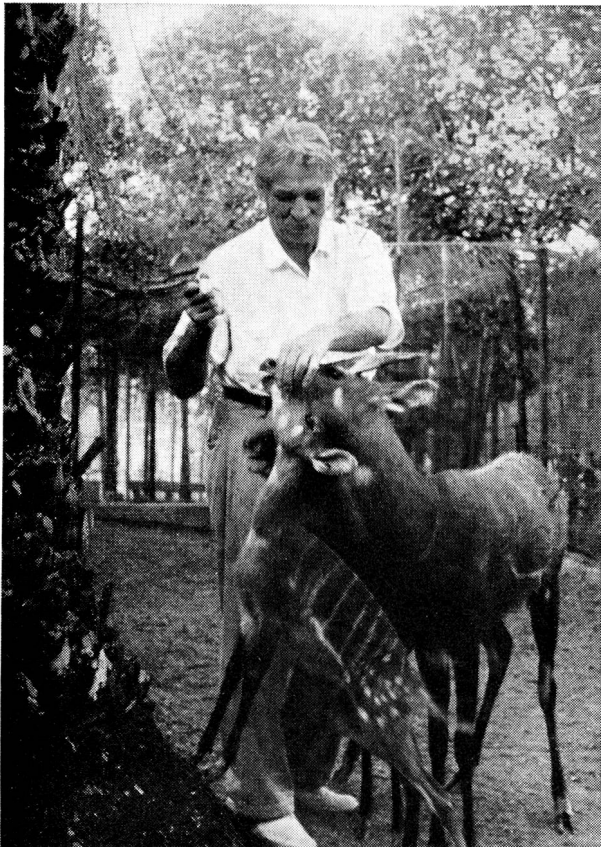
Albert Schweitzer in Lambarene mit seinen zahmen Antilopen.

Im Pfarrhaus von Günsbach war das Verhältnis zwischen den Eltern und Kindern ein ideales. Von der Schule und später von der Hochschule durften die Kinder ihre Schulfreunde mit in die Ferien bringen, bis das Haus voll war. Der Gedanke, dass er eine so einzigartig glückliche Jugend erlebte, beschäftigte Schweitzer fort und fort — und immer deutlicher stellte sich aus diesem Glück heraus die Frage nach dem Recht auf dieses Glück, die Frage, ob man es als etwas so Selbstverständliches hinnehmen dürfe. Sie wurde das zweite grosse Erlebnis und trat neben das andere, das ihn schon aus der Kindheit her begleitete: das Ergriffensein vom Weh ringsum in der Welt. Langsam schoben diese Erlebnisse sich ineinander, und sie sind es, die Auffassung und Schicksal dieses Lebens entscheiden.