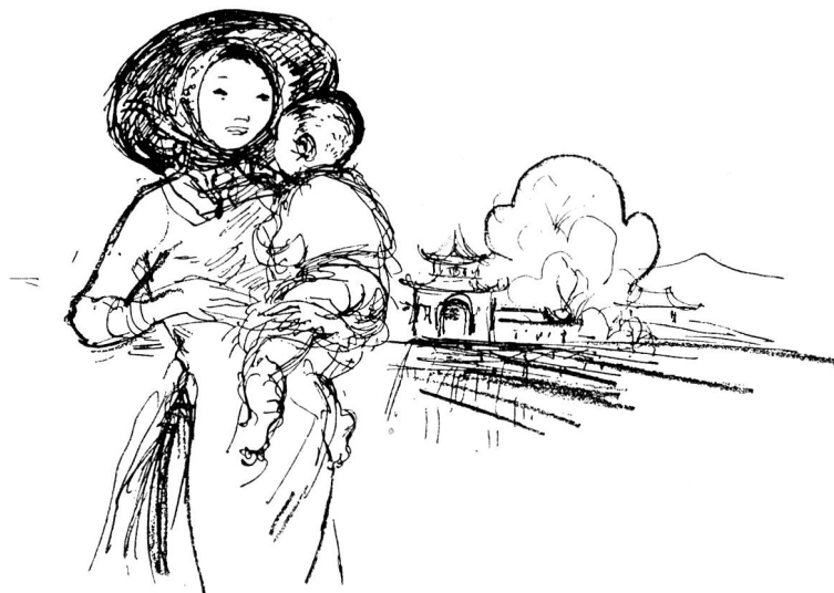
Junge Vietnamesin mit Kind. Zeichnung von Margarete Lipps, Zürich.

fängts, ist die Hilfe von oben am notwendigsten; von der Güte dieses Anfangs hängt die weitere Folge ab. Deshalb ist der Erste des Mondmonats der Tag, an dem man gewöhnlich der Gottheit seinen Besuch abstattet und sich ihrer Hilfe versichert. Am