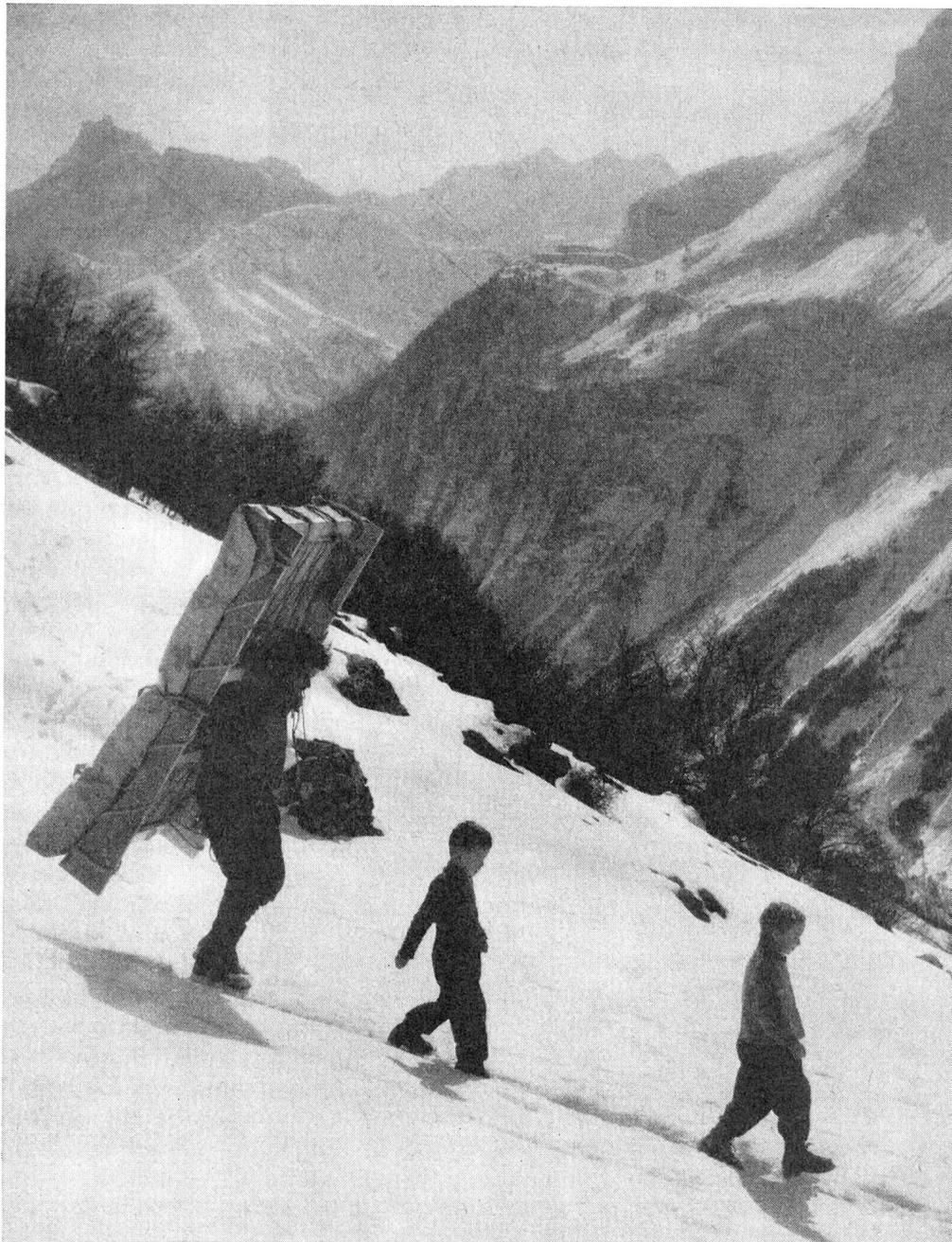
Diese Bergbauernfamilie, die ein Bett für das älteste Kind erhalten hat, wohnt hoch oben im Schächental.

Dank den Patenschaften vermochte das Schweizerische Rote Kreuz bis Ende März 1957 schon 1643 Familien ein komplettes Bett sowie zusätzlich noch 900 Pakete Bettwäsche für schon vorhandene Betten zuzustellen.