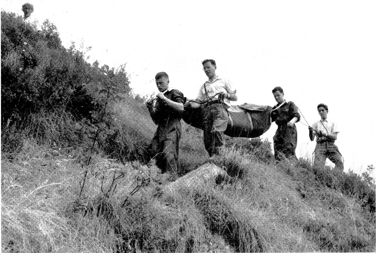
Das vielbeachtete Transportgerät der Juniors des Französischen Roten Kreuzes wurde von den Juniors der verschiedenen Länder ausprobiert, photographiert und die einzelnen Bestandteile skizziert.