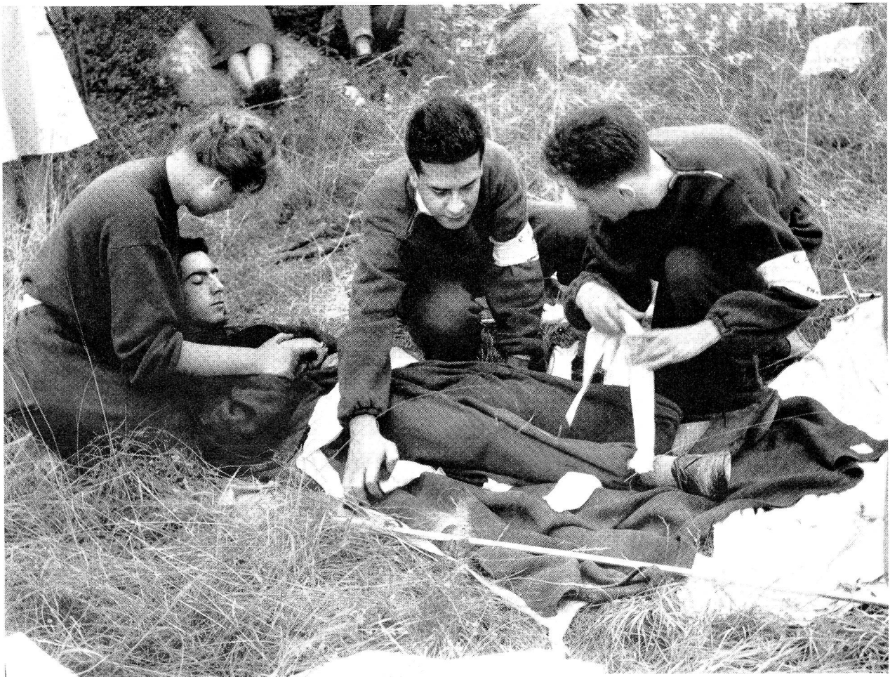
Die Juniors des Italienischen Roten Kreuzes simulierten einen schweren Skiunfall und brachten, kritisch beobachtet von den Juniors anderer Länder, die Erste Hilfe.