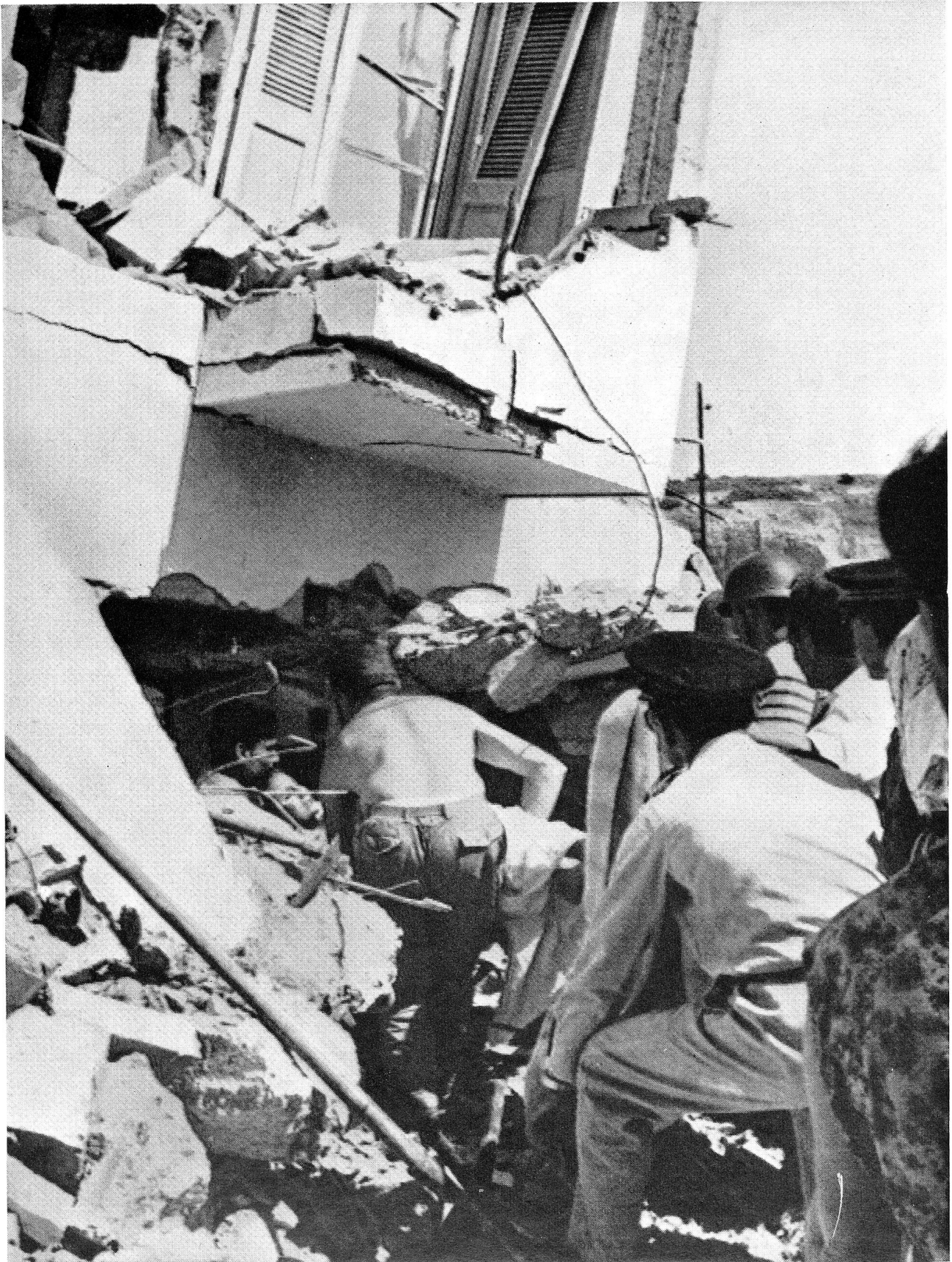
Mit grösster Schwierigkeit und unter eigener Lebensgefahr haben sich französische und marokkanische Offiziere und Soldaten sowie Matrosen verschiedenster Herkunft für die Rettung der Verschütteten und die Bergung der Toten Tag und Nacht eingesetzt. Vierzehn Tage nach der Schreckensnacht sind noch Überlebende geborgen worden, nachdem sie Tag um Tag, Stunde um Stunde auf Rettung gewartet und wohl schon alle Hoffnung aufgegeben hatten.