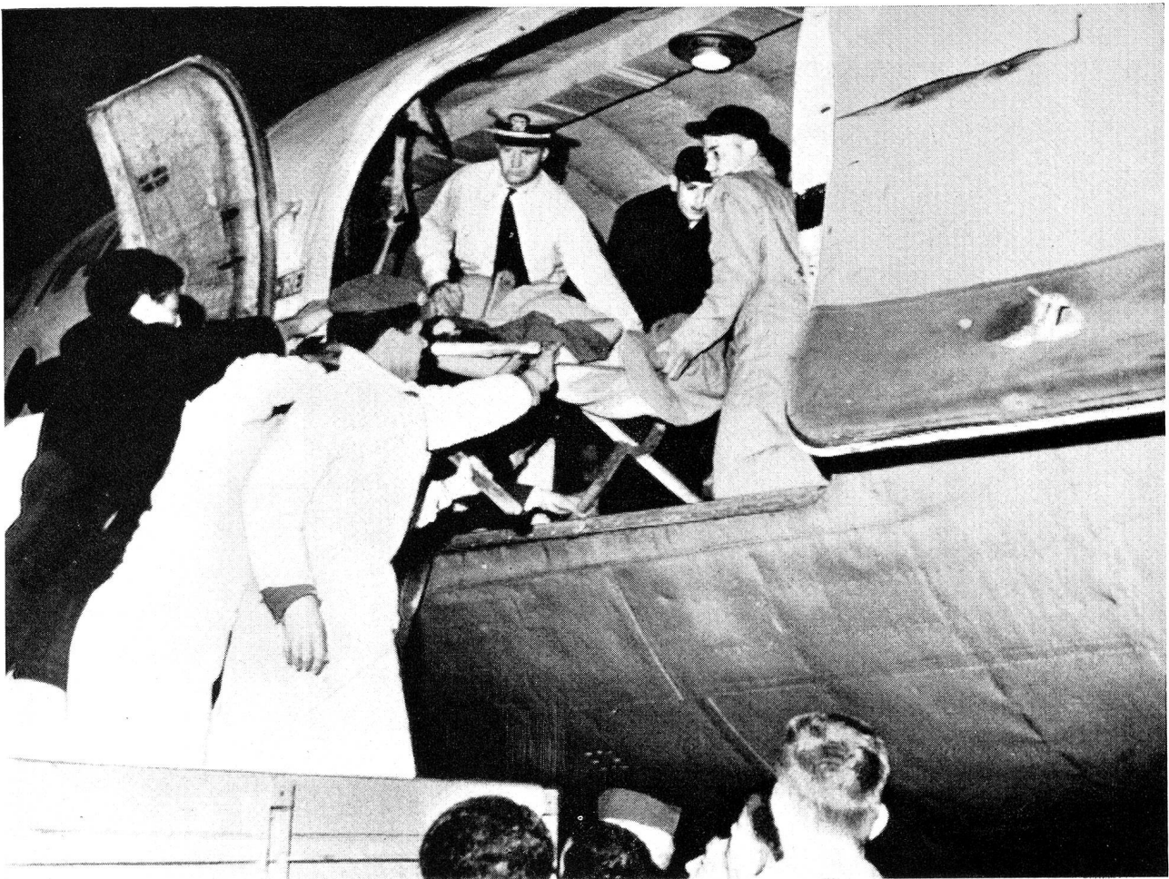
Flugzeuge verschiedenster Herkunft, vor allem aber französische und amerikanische Transporter, brachten die Verwundeten in die verschiedenen Städte Marokkos und nach Frankreich.