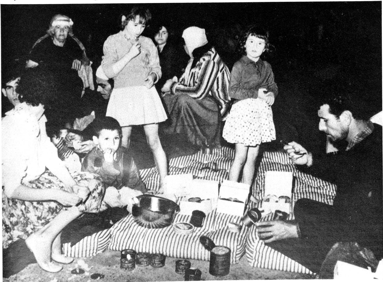
Eine französische Familie von Agadir, die nur das nackte Leben retten konnte, kumpiert im Freien.