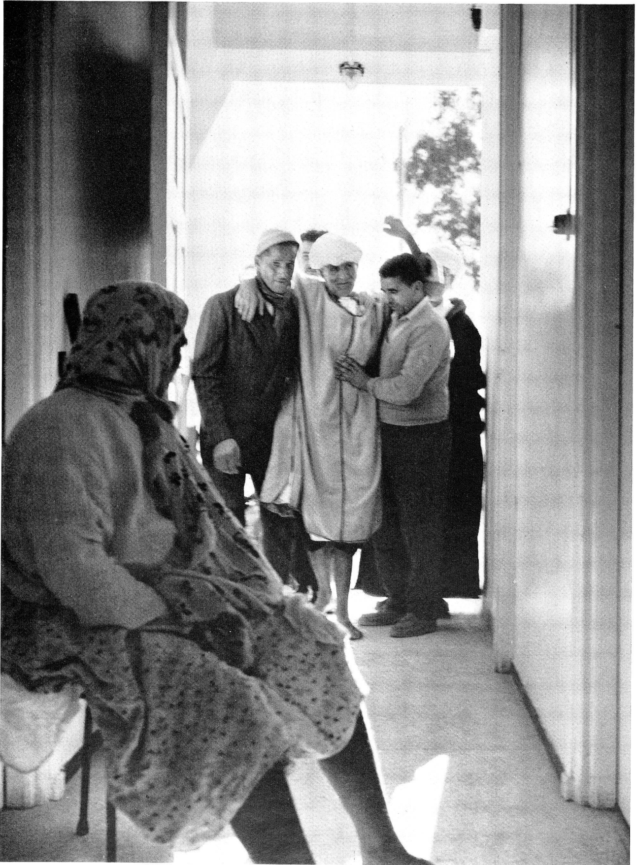
Angehörige bringen einen Beingelähmten zur Behandlung. Da die Hospitalisierung, die ungefähr 30 Prozent der Erkrankten betrifft, erst anfangs April beginnen kann, müssen die Fälle, die ins Spital gehören, vorläufig noch ambulant behandelt werden. Sie werden auf die verschiedenste Weise ins Behandlungszentrum gebracht, sei es auf einem Karren, sei es auf dem Rücken eines kräftigen Verwandten. Nach der Behandlung führt sie der gleiche mühsame Weg wieder heim.