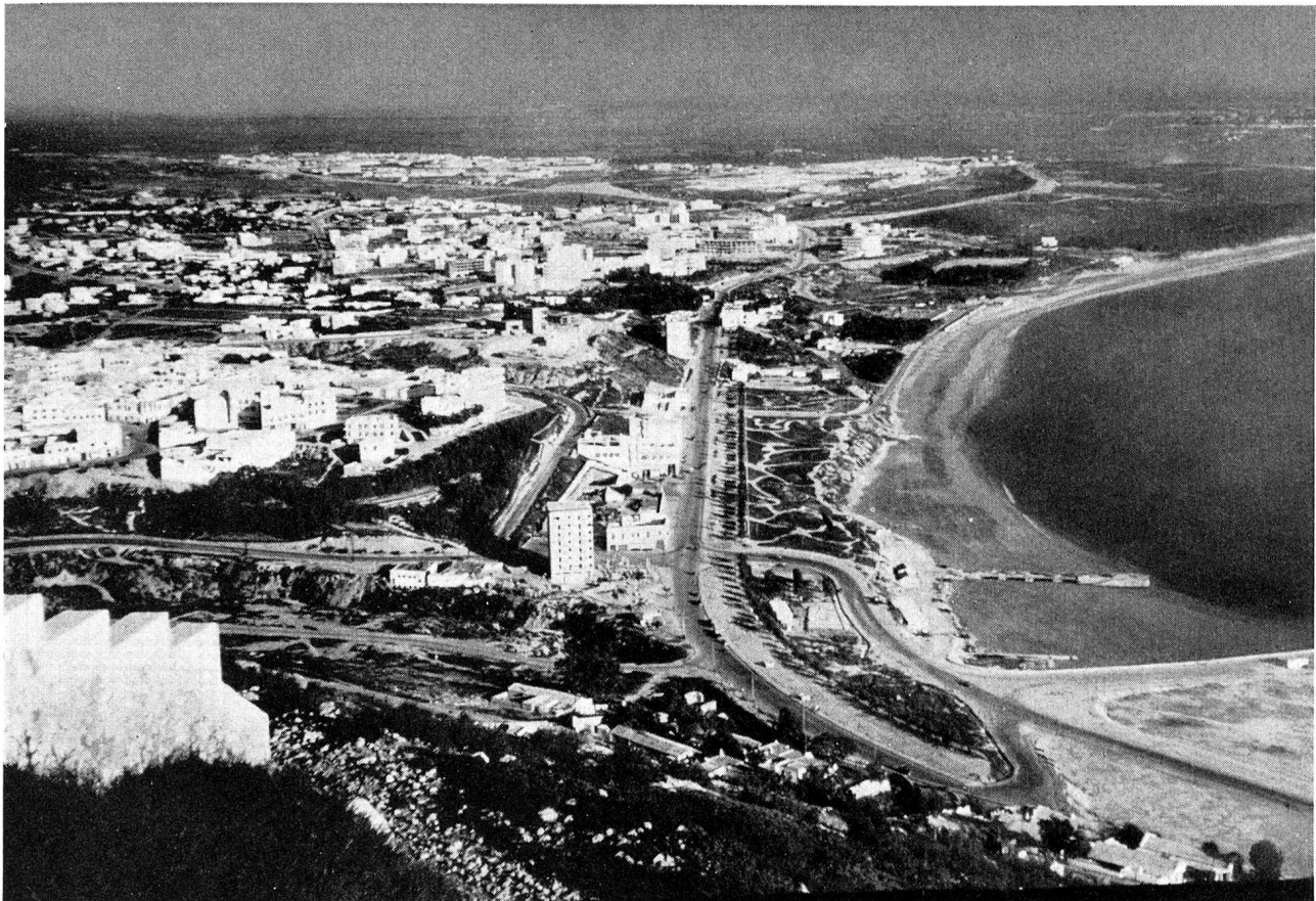
Die strahlende südmarokkanische Stadt Agadir vor dem Erdbeben in der Nacht vom 29. Februar zum 1. März 1960. Wenige Stunden nach dem Erdbeben traf König Mohamed V. in Agadir ein und besichtigte erschüttert die zerstörte Stadt.