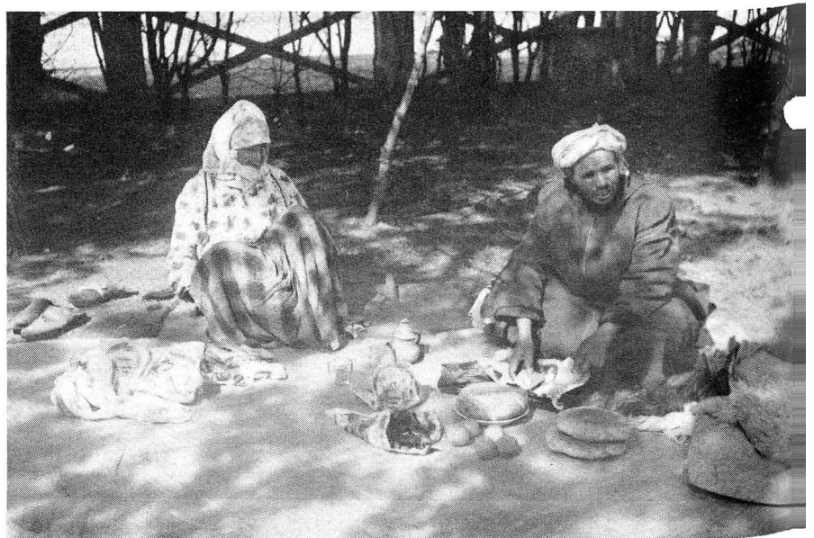
Wenn die Ögelähmten zur Behandlung von weither kommen, nehmen sie ihre Mahlzeit mit und setzen sich irgendwo in den Schatten in der Nähe des Behandlungszentrums. Die Stellung der Diagnose für einen jeden einzelnen der zehntausend Ögelähmten ist Ende März beendet worden, mit der Behandlung durch die Physiotherapeutinnen konnte jeweils in fünf Behandlungszentren sofort begonnen werden. Einige tausend der Unglücklichen werden sich einer physiotherapeutischen Behandlung von mehreren Jahren unterziehen müssen.