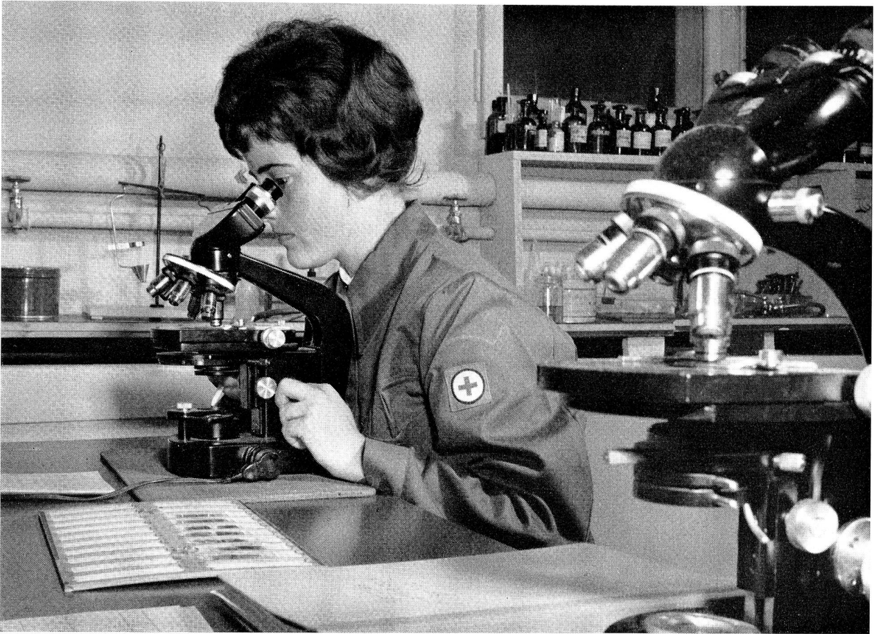
Zur Betreuung der Laboratorien in den Militärspitälern bedarf der Rotkreuzdienst fachlich geschulter medizinischer Laborantinnen, die den Rotkreuzdetachementen zugeteilt werden. Bild unten: Die Hilfspflegerinnen des Rotkreuzdienstes sind die rechte Hand der Krankenschwestern. Sie versuchen sie so viel als möglich zu entlasten.