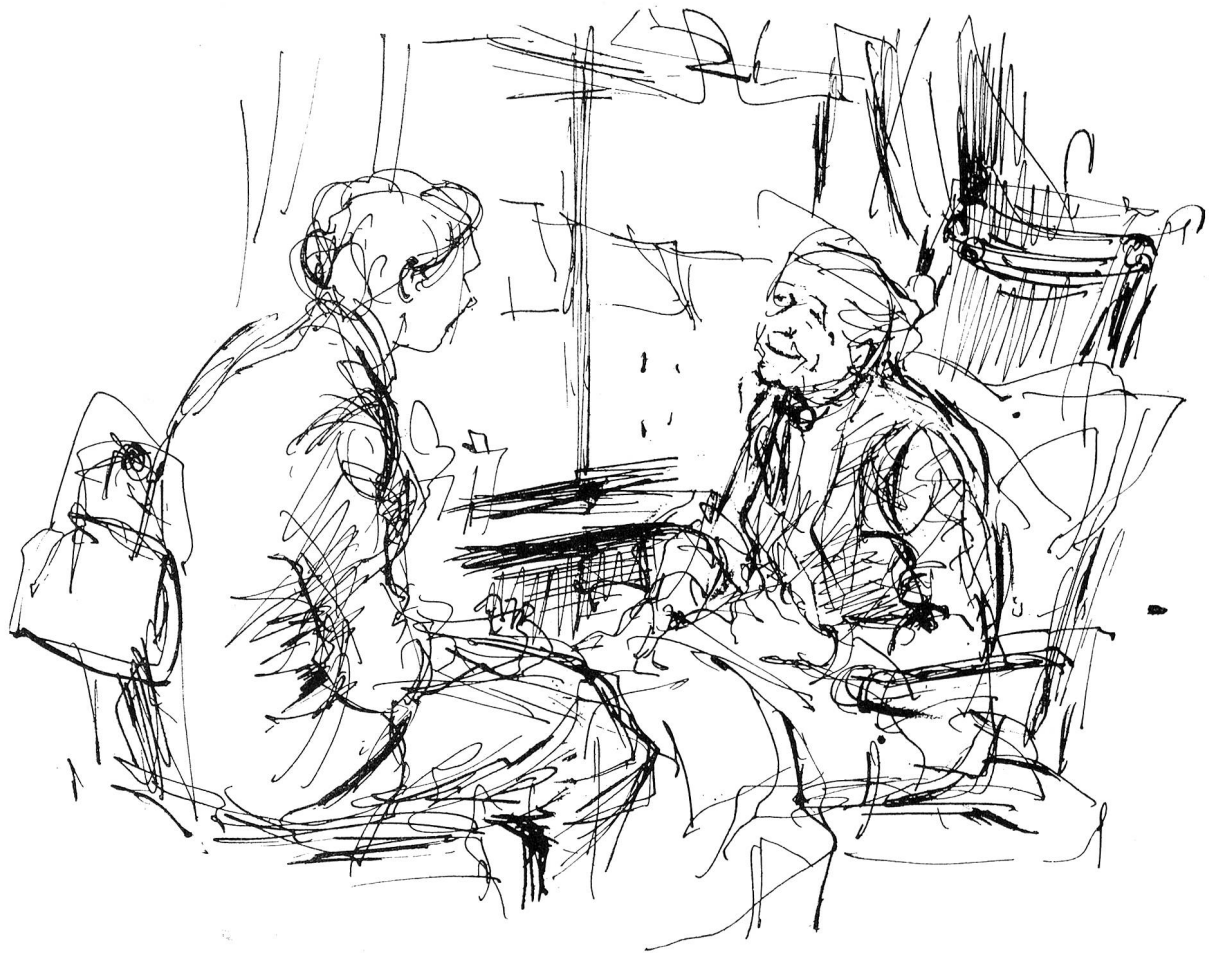
Zeichnung von Margarete Lipps, Zürich

Helferin das ganze vielgestaltige, geheimnisvolle Leben, und je grösser ihr Helferwille, je besser ihr Einfühlungsvermögen ist, desto richtiger und umfassender vermag ihre Hilfe zu werden. Die Helferin wird zum Freund, Berater und Helfer in dunkeln und hellen Stunden. Und durch das wachsende Vertrauen, durch den lebendigen Kontakt zwischen Patient und Helfer gelingt es, diese vom Schicksal oft hart betroffenen Menschen aus ihrer Vereinsamung, ihrer Lethargie, aus Freud- und Mutlosigkeit herauszuholen und ihnen das Gefühl einer neuen lebendigen Gemeinschaft zu geben. Wie viel Geduld, wie viel Ausdauer und wie viel aufopfernde Hilfe Woche für Woche während langer Jahre dieser Dienst, von dem meist nicht viel Aufhebens gemacht wird, erfordert, braucht kaum erwähnt zu werden.