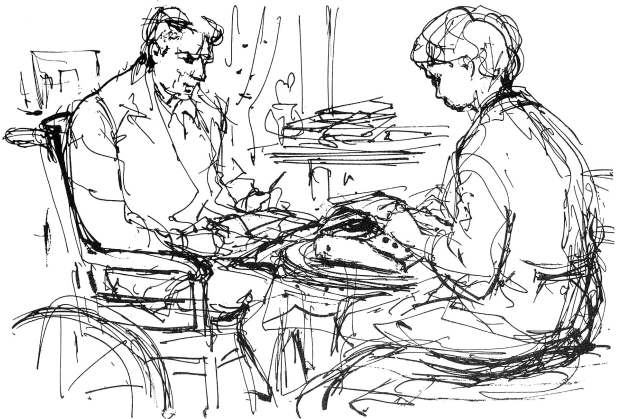
Zeichnung von Margarete Lipps, Zürich

Rotkreuz-Arbeit ist nie abgeschlossen. Auch die Rotkreuzhelfer-Arbeit ist in steter Entwicklung begriffen. Es zeigen sich immer neue Probleme und neue Aufgaben, die einer Lösung harren. Es zeigen sich aber auch immer neue Möglichkeiten, wie die erfreuliche Entwicklung in den Rotkreuz-Sektionen zeigt. Solange wir uneigennützig dem Nächsten helfen, solange gehen wir den richtigen Weg. Und der Dank des zu Beschützenden wird zum Segen des Helfers. Vielleicht darf abschliessend noch gesagt werden, dass in dem Masse, in dem auch die Familie, der Freundeskreis an diesem Rotkreuz-Dienst Anteil nimmt, auch die junge Generation erlebt, dass selbst in Zeiten der Hochkonjunktur vereinsamte, alte und kranke Menschen der Hilfe des Nächsten bedürfen. «Das Alleinsein unter Menschen hat in der Gesellschaft Gottes einen Freund, wenn die Liebe, die allereinfachste Nächstenliebe mit ein wenig Güte und Grossmut, am Leben bleibt», sagt Edzard Schaper.