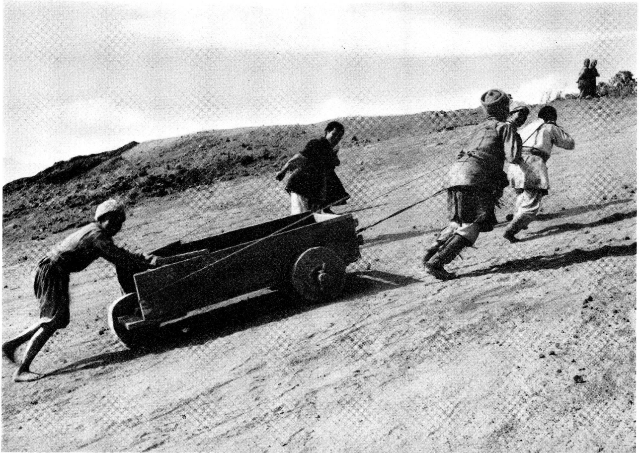
Oberes Bild: Solche selbstgebauten Karren dienen in Chialsa, Solu, für den Wegtransport des Aushubs beim Ausbau der Fluggpiste. Es bedarf der Zugkraft von fünf bis sechs Tibetern, um den Karren bergaufwärts zu ziehen. Unteres Bild: In einer windgeschützten Ecke arbeiten im Handwerkszentrum des Solu tibetische Spinnerinnen und Weberinnen.