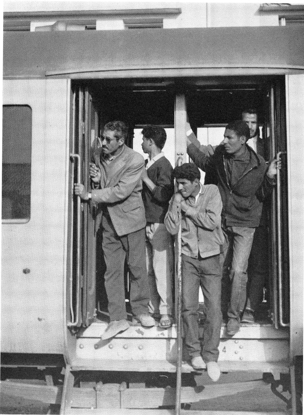
Der erste Zugtransport von Oujda (Marokko) nach Tlemcen (Algerien) fand am 10. Mai 1962 statt. Dieser Zug brachte 193 allein-stehende algerische Flüchtlinge, alles Männer, in ihre Heimat. Sie verabschiedeten sich mit ernsten Gesichtern von ihren Kameraden, die noch für einige Tage, vielleicht noch für einige Wochen in Oujda zurückblieben, bis die Reihe an ihnen war, in ihr Land zurückzukehren. Keiner kennt die Zukunft. Für manch einen Heimkehrten wird sie hart sein.