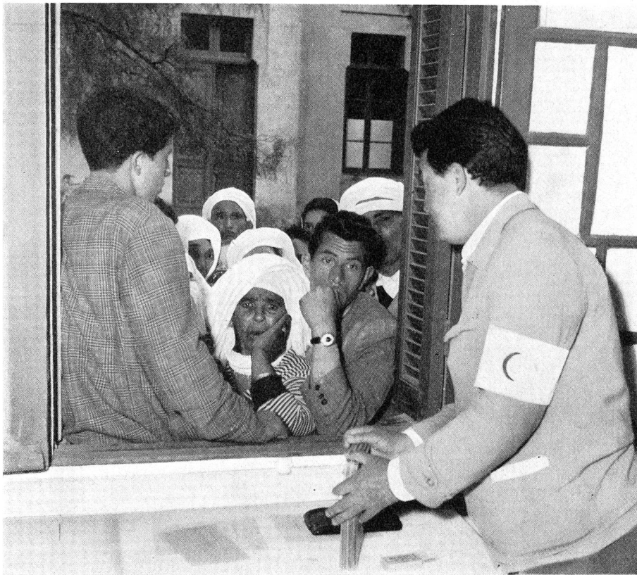
Vor der Abreise der algerischen Flüchtlinge in Oujda (Marokko) werden die Ausweispapiere, die alle von den Delegierten der Liga der Rotkreuzgesellschaften in mühevoller Kleinarbeit ausgestellt und mit einer Foto des Inhabers versehen worden sind, noch einmal überprüft und die Foto mit dem Besitzer der Papiere verglichen.