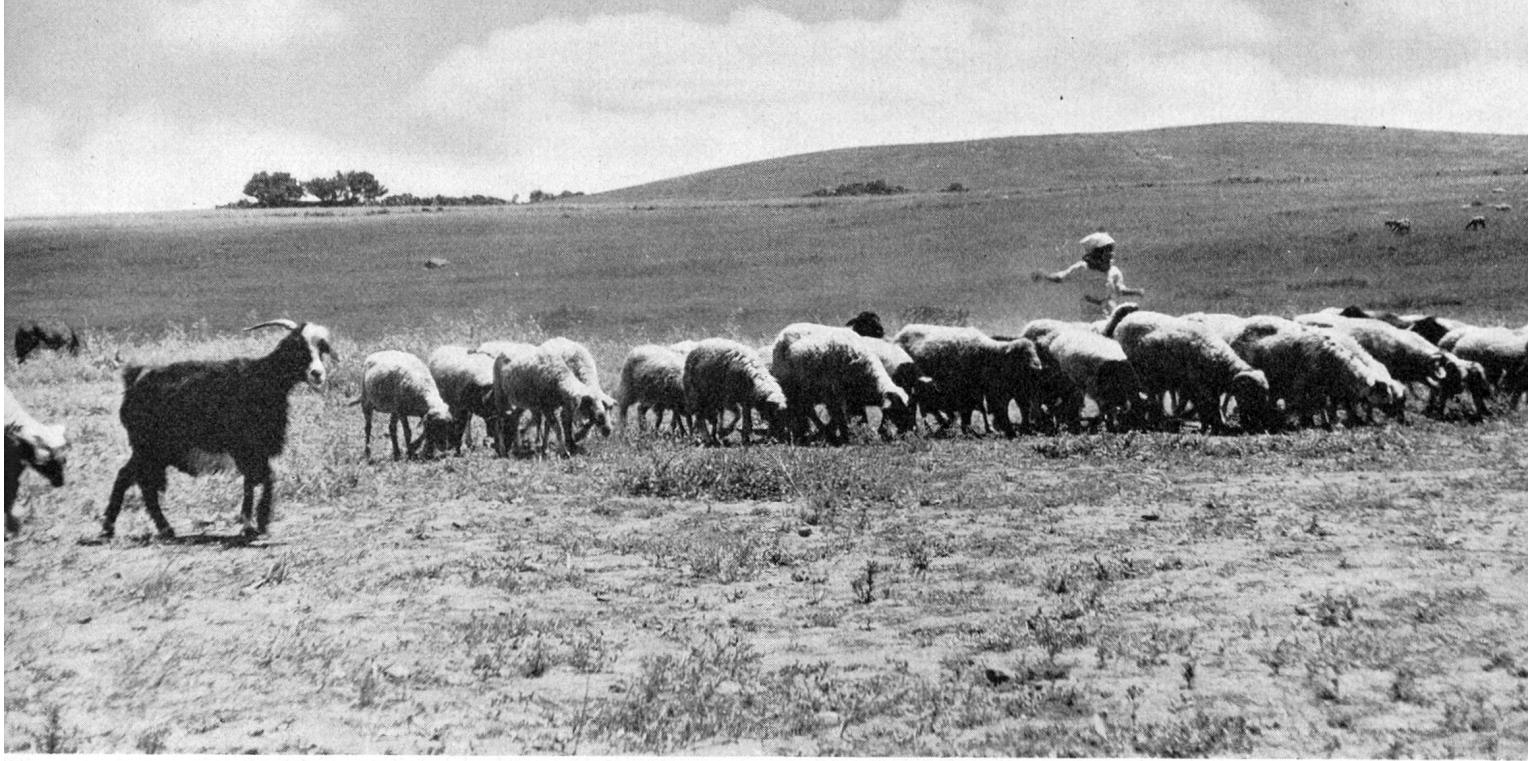
Die Nomaden treiben ihre Herden zusammen, um sie dann nachts auf schmalen entmintem Streifen durchs sonst überall vermintete Niemandsland hinüber nach Algerien zu führen, was von den Hirten und Hirtinnen grosse Geschicklichkeit erfordert und nicht ungefährlich ist.