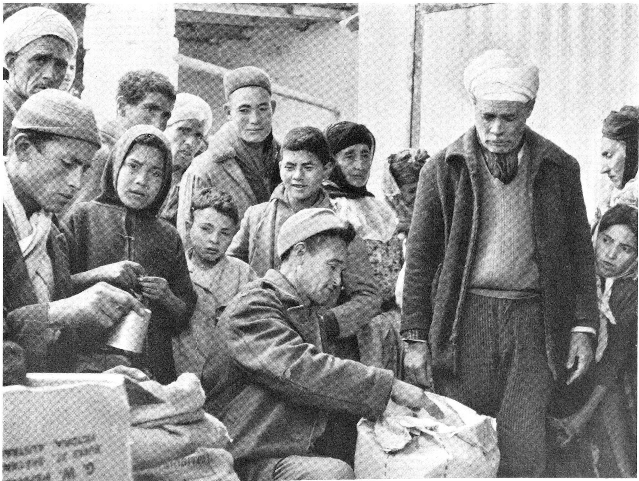
Bevor die Flüchtlinge Marokko oder Tunesien verlassen, erhalten sie noch Lebensmittelrationen, die sie im ersten Monat ihrer Heimkehr über Wasser halten sollen, bis die Lebensmittelverteilungen in ihrem Heimatgebiet einsetzen werden.