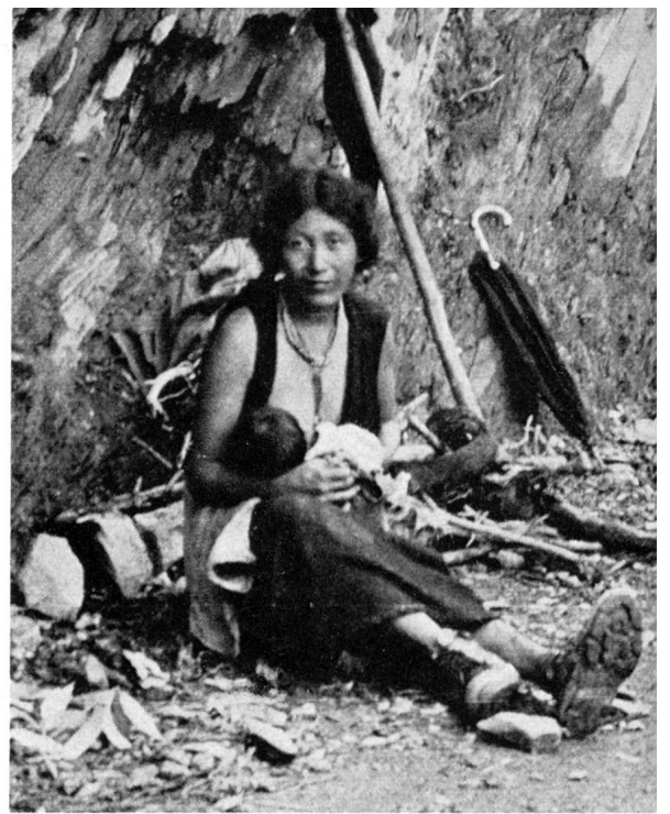
Der Säugling wird während der Arbeit an den Strassenrand gebettet. Von Zeit zu Zeit legt ihn die Mutter an die Brust. Fallen die schweren Regen, wird ein Schirm übers Kleine gespannt.

Die Frauen stehen bei der Arbeit oft knöcheltief im Schlamm. Sie benützen die Schaufel in der alten Weise, wie sie noch heute in weiten Gebieten Asiens üblich ist. Da in Indien grosse Arbeitslosigkeit herrscht und dieses Land gegen eigene soziale Schwierigkeiten von riesigem Ausmass zu kämpfen hat, müssen sich die tibetischen Flüchtlinge noch glücklich schätzen, dank der Strassenarbeit das Leben, und sei es noch so karg, verdienen zu können.