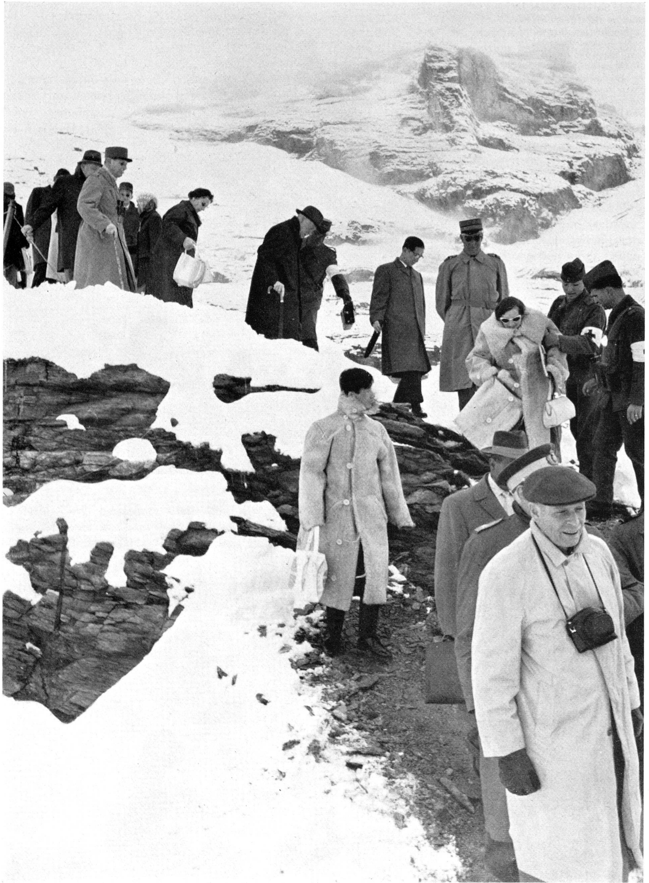
Angesichts des nassen, glitschigen Neuschnees und des ungeeigneten Schuhwerks manch eines Gastes wurden unsere Sanitätssoldaten zu wahren Rittern. Sie boten überall dort, wo der Pfad zu den Demonstrationsplätzen schwierig wurde, die kräftighelfende Hand.