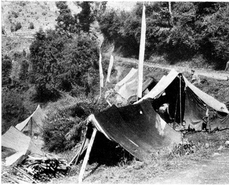
Tausende von tibetischen Frauen sind heute für den Bau strategischer Strassen eingesetzt. Sie leben in leichten Zelten am Strassenrand, mit denen sie dem fertigerstellten Strassenstück nachziehen.