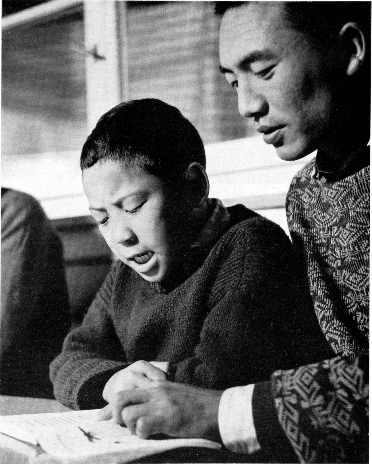
In den schweizerischen Heimstätten für die tibetischen Flüchtlinge erhalten die Kinder im Schulalter, wenn sie nachmittags von der Dorfschule heimkehren, noch Unterricht in tibetischer Sprache durch ihre geistigen Lehrer, die Lamas, die in der Gruppe leben und sich in besonderem Masse der Kinder annehmen.