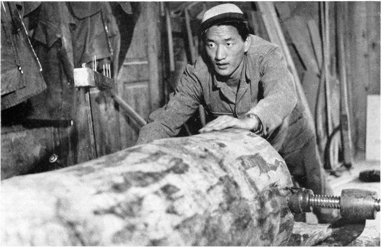
Die erwachsenen Tibeter arbeiten in unserem Land als Hilfsarbeiter in handwerklichen Gewerben oder mechanischen Kleinbetrieben. Die Arbeitgeber sind überall mit ihren Leistungen zufrieden.