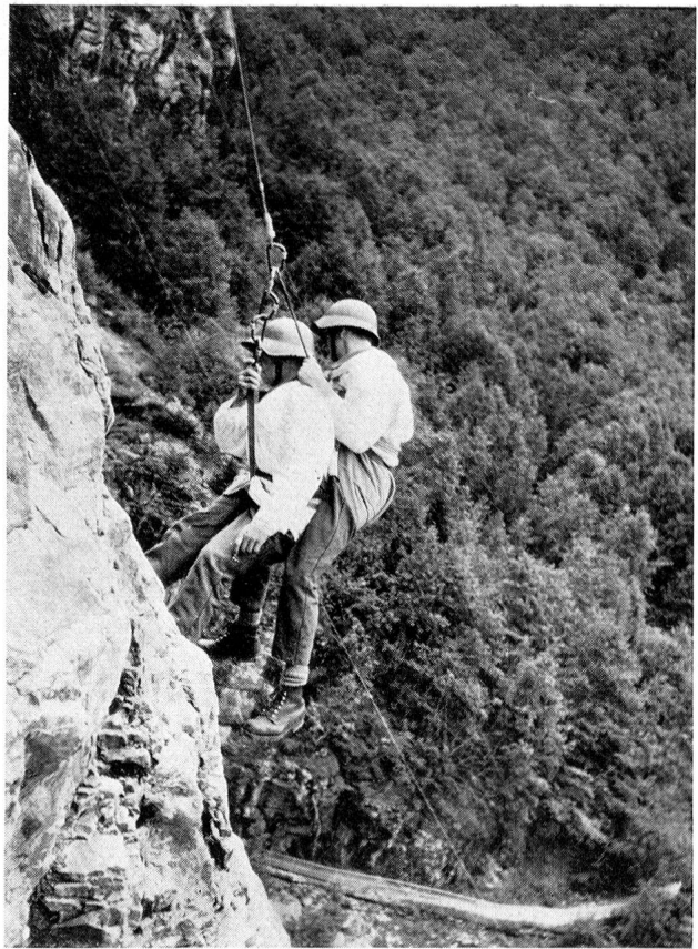
Stahlseilgeräte, Gebirgsrollbahnen, Einrad-Gebirgstrage und verschiedene Hilfsmittel für den Transport auf dem Rücken des Retters gelangten zum Einsatz.