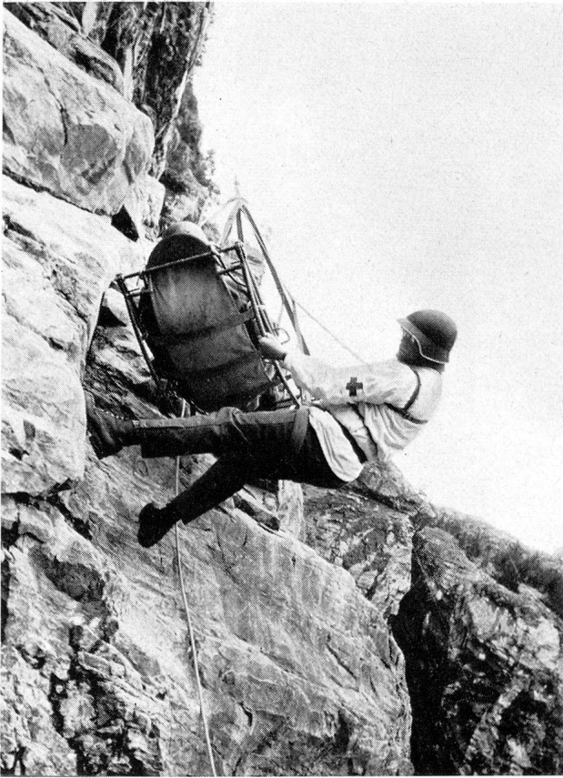
Die Abseil-Rettungsübungen an steiler Felswand wurden mit angespanntem Interesse verfolgt.