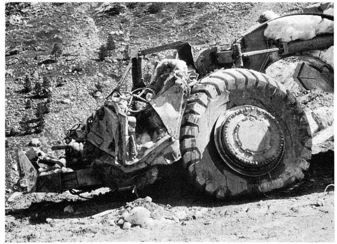
Maschinen wie diese, bis zu 42 Tonnen schwer, standen völlig zertrümmert herum.

mehr lohnte. Dort, in der Werkstatt, ereilte sie das Unglück. Sie wurden unter den gewaltigen Eismassen begraben, das Eis presste die mehr als dreissig Tonnen schweren Fahrzeuge in wuchtigem Aufprall zusammen, als seien sie Papier.