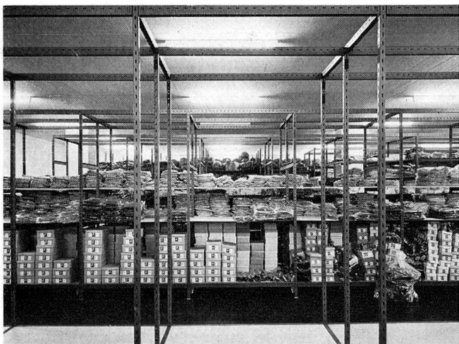
Auch das unscheinbarste Material ist übersichtlich in den grossen Regalen gelagert.