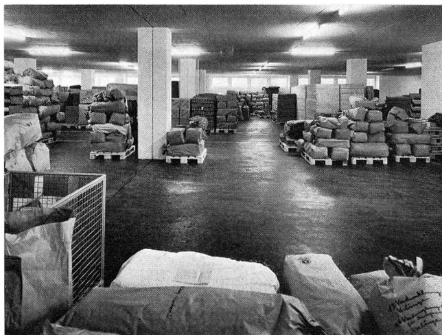
Sauber auf Paletten aufgeschichtet können die Waren nun von einer einzigen Kraft in kürzester Frist verladen werden.

Der gesamte Bau wurde als reiner Eisenbetonbau mit unterzugslosen Decken ausgebildet. Die isolierten Aussenwände sind mit Welleternit verkleidet. Bis zu einem unerwarteten Wassereinbruch bei den Aushubarbeiten, der zum kostspieligen und zeitraubenden Einbau von Felsankern zwang, verliefen die Bauarbeiten reibungslos.