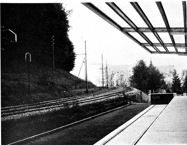
Die neue Bahnrampe erlaubt einen Warenumschlag in fast beliebigen Mengen.

8. Eine Notstromgruppe von zweihundert Kilowatt, an der notfalls sogar ein Warenlift angeschlossen werden kann, ist vorgesehen.