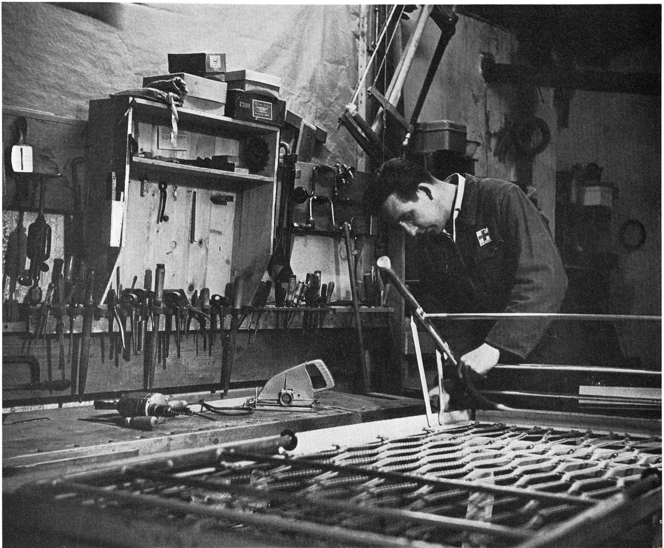
Die Werkstatt des bisherigen Lagerhauses war so eng, dass beispielsweise eine reparaturbedürftige Matratze den ganzen Raum einnahm.

zahlreichen Spenden, die jede Woche eintreffen, da sind die Uniformen, die den Mitarbeitern in Rotkreuzmission zur Verfügung gestellt werden (beispielsweise der medizinischen Equipe im Kongo oder in Jemen).