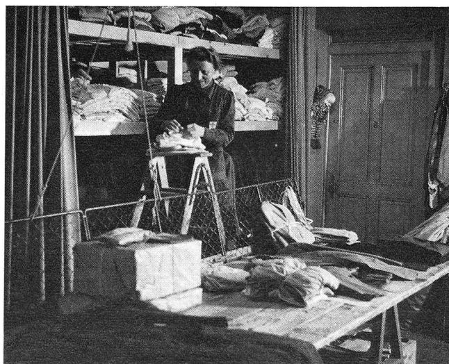
Oft musste sogar die Leiter als Tisch herhalten.

Es wäre recht aufschlussreich, aus den Bestandeslisten der Materialzentrale einige Zahlen anzuführen, die einen Einblick vermitteln in das, was beim Schweizerischen Roten Kreuz alles eingelagert werden muss. Doch begnügen wir uns damit, nur summarisch verschiedene Waren anzuführen: Da ist das umfangreiche Mietmaterial (Spitalsortimente, Kisten mit Unterrichtsmaterial für Kurse der häuslichen Krankenpflege, für Kurse zur Pflege von Mutter und Kind, für Kurse der Ersten Hilfe usw.), da ist das Drucksachenmaterial, da ist das Neumaterial, das für den Katastrophenfall bereitsteht (Betten, Bettwäsche, Wolldecken, Kleidungsstücke usw.), da sind die