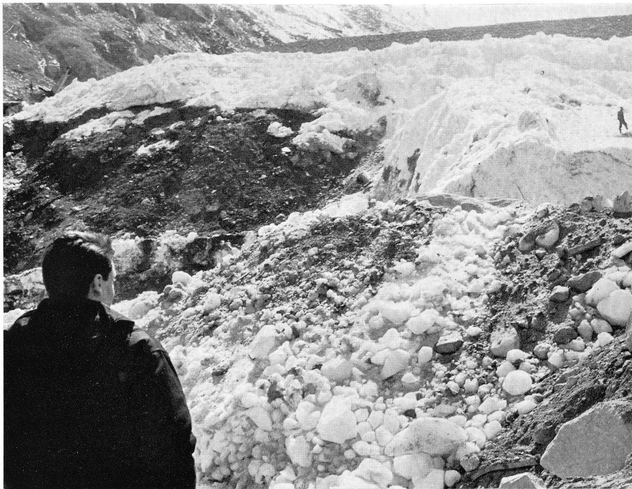
Dieser junge Italiener hat seinen Bruder bei dem Unglück verloren. Fassungslos blickt er auf das riesige Trümmerfeld aus Eis, Schutt und Geröll. Wie lange wird es dauern, bis man alle Toten geborgen hat?

gegenüber dem Anfang zu erkennen. Wohl konnten Tote geborgen werden, wohl hatte man hier und dort Kleidungsstücke gefunden, wohl war man unter gewaltigen Eisblöcken auf zertrümmerte Fahrzeuge gestossen, doch immer wieder mussten die Rettungsarbeiten eingestellt werden, weil neue Gletscherabbrüche zu befürchten waren.