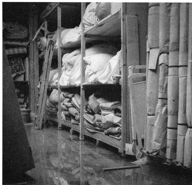
In der Enge des bisherigen Lagerhauses war eine Trennung der einzelnen Lagergüter technisch unmöglich. Nach Gewittern und schweren Regenfällen stand das Wasser in grossen Pfützen am Boden.

mit Einordnung und Versand der Waren betraut waren, nahezu Wunderwerke vollbringen mussten, wenn sich ein Katastrophenfall ereignet hatte oder aber eine grössere Materialbestellung eingegangen war, befand sich das Lagerhaus an vielen Stellen in recht baufälligem Zustand. Nach starken Regenfällen oder Gewittern bildeten sich beispielsweise grosse Pfützen auf dem Boden.