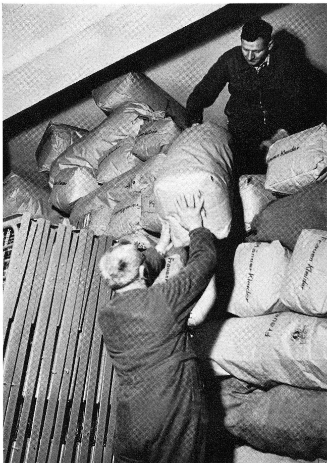
Unser Bild zeigt besser als viele Worte, mit welcher Zeitverschwendung im alten Lagerhaus des Schweizerischen Roten Kreuzes gearbeitet werden musste.