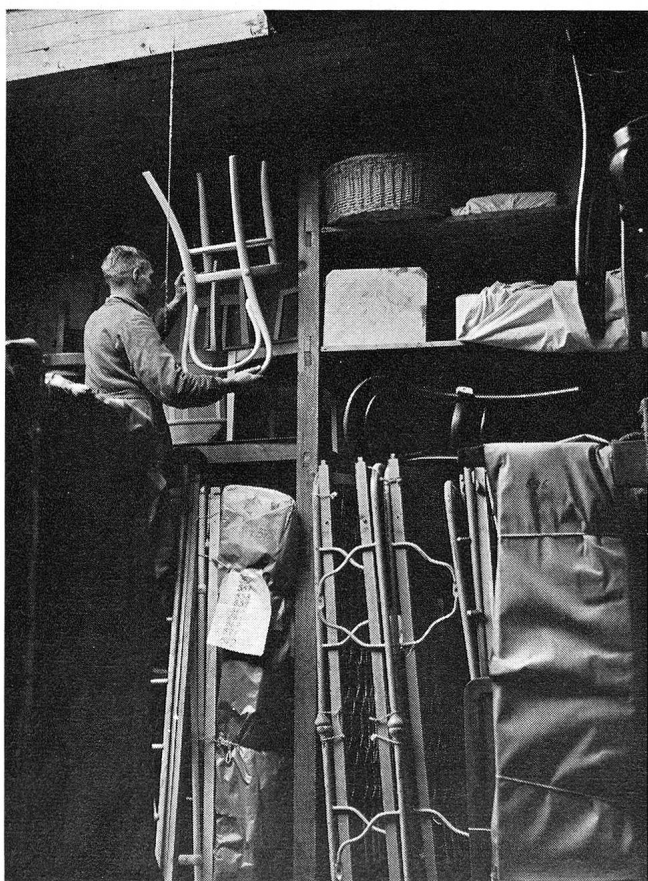
Das Herunternehmen eines Stuhles stellte fast eine akrobatische Leistung dar.