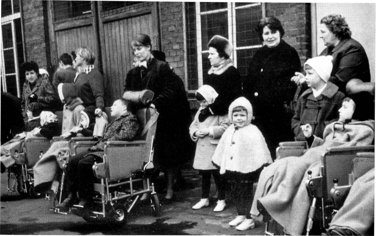
Kinder aus Bonn, die vom Deutschen Roten Kreuz zu einer Probefahrt mit dem Schweizer Freundschaftscar eingeladen wurden, verfolgen gespannt die für sie veranstaltete Uebung der Feuerwehr.