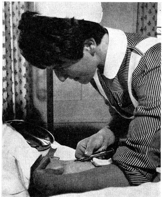
Unter den Pflegezweigen mit dreijähriger Ausbildungsdauer ist der Beruf der Psychiatrieschwester und des Psychiatriepflegers am meisten mit Vorurteilen belastet. Wie wichtig ist da der Hinweis, dass heute in den psychiatrischen Kliniken eine gelöste, freundliche Atmosphäre herrscht.