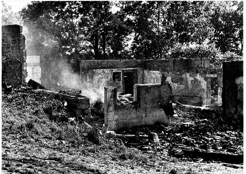
Brandfälle ereignen sich trotz Sicherungsmassnahmen immer noch häufig, und manchmal bleibt von einem Haus, das einer Familie während vieler Jahre Heimat bedeutete, nur noch ein Schutthaufen. Das Rote Kreuz hilft den in Not Geratenen mit Möbeln, Kleidern und Hausrat.

Wir gehen zu der jungen Frau, die dort sitzt, vom Schreck noch ganz benommen. Am Nachmittag des Vortages war es geschehen: Der Blitz hatte eingeschlagen und innert kürzester Zeit das alte Bauernhaus eingeschert, in das sie vor kurzem erst, aus der Stadt kommend, als Mieter eingezogen waren, sie und ihr Mann mit ihrem achtjährigen Kind. Nun standen sie da und hatten nichts mehr, als was sie auf dem Leibe trugen.