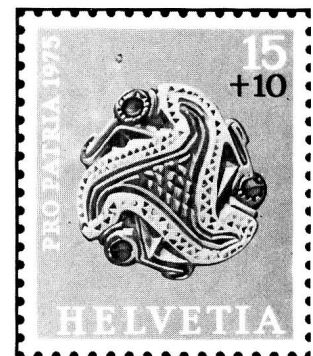
Goldene Gewandschliesse Frühmittelalter