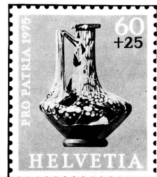
Glaskrug Römische Zeit