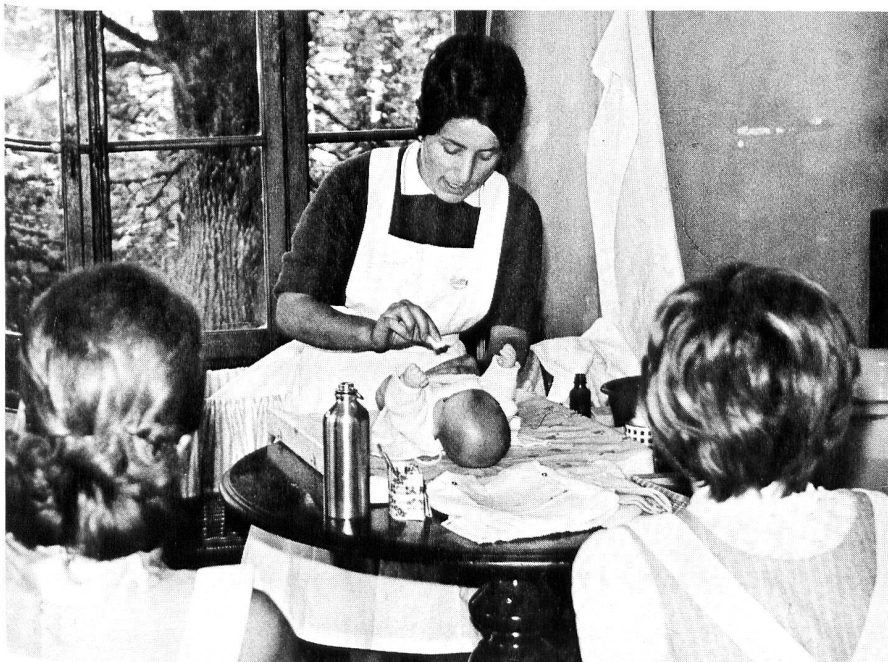
Zu Stadt und Land findet der Kurs «Pflege von Mutter und Kind» immer viele begeisterte Teilnehmerinnen und Teilnehmer. Die Lehrerinnen sind speziell ausgebildete diplomierte Kinderkrankenschwestern.

Mit Argusaugen beobachten die Kursteilnehmer und natürlich vor allem die Kurslehrerin, ob keine groben Fehler gemacht werden. Unendlich behutsam, als ob es sich um ein wirkliches Neugeborenes handle, wird das Gesichtchen gewaschen, das Hemdchen angezogen, wird das Drehen des kleinen Körpers vom Bauch auf den Rücken oder umgekehrt versucht. Dabei kann es passieren, dass der Puppenkopf fast unter Wasser gerät, aber häufiges Üben bringt Fertigkeit. Im Laufe des Kurses werden die frischgebackenen Väter und Mütter noch oft Gelegenheit haben, sich die richtigen Handgriffe einzuprägen. Die Männer stellen sich durchaus nicht ungeschickter an als ihre jungen Gattinnen und scheinen grosses Vergnügen daran zu finden, mit dem Bébé umzugehen. Eine Teilnehmerin seufzt erleichtert auf, als sie nach glücklich durchgespieltem Baden und Wickeln das Puppenkind der nächsten Frau zum Üben gibt und sagt in freudiger Erregung: «Jetzt habe ich zum erstenmal ein Kleines gebadet; wie oft werde ich das in Zukunft wohl noch tun!»