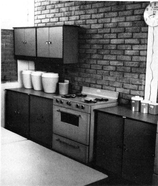
Die am 26. Februar 1976 eingeweihte Haushaltungsschule in der Vorortssiedlung OPEN 3 von Managua (Nicaragua) wurde mit Geldern des SRK, des Hilfswerks der Evangelischen Kirchen der Schweiz und des Bundes gebaut. Das Heks und das SRK kommen auch für die Betriebskosten der ersten Jahre auf. Im ersten Halbjahr seit der Eröffnung absolvierten 85 Mädchen und junge Frauen den Nähkurs und 12 den Kochkurs. Vorher hatten die Mädchen keine Möglichkeit irgendwelcher Weiterbildung nach der