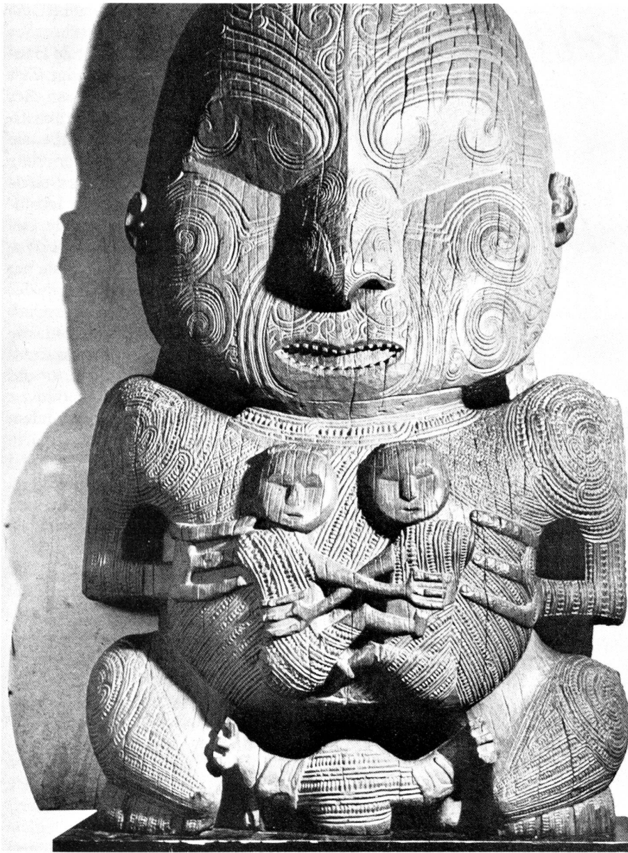
Monumentale Holzskulptur des Maori-Häuptlings Pukaki; Auckland-Museum, Neuseeland. Denken wir im Zusammenhang mit Entwicklungshilfe jeweils daran, dass Zivilisation nicht Kultur bedeutet, dass die Entwicklungsländer Anrecht auf Erhaltung und Pflege ihrer eigenen Kultur haben?

weise über eine oder mehrere Rekrutierungsstellen in Europa verfügen. Auch die Schweiz wäre durchaus in der Lage, für mehrere Länder gleichzeitig die Suche von Personal zu übernehmen, wobei dann der oder die Verantwortlichen der betreffenden Entwicklungsländer die definitive Rekrutierung vornehmen würden. Die normale Vertragsdauer eines Experten beträgt zwei Jahre. Das ist nicht lange genug. Welcher andere Arbeitgeber würde unbesorgt hinnehmen, dass ein neuer Angestellter mit der Idee, nicht länger als zwei Jahre zu bleiben, einsteigt? Und wenn der Arbeitgeber nur allzu gut weiss, dass sein