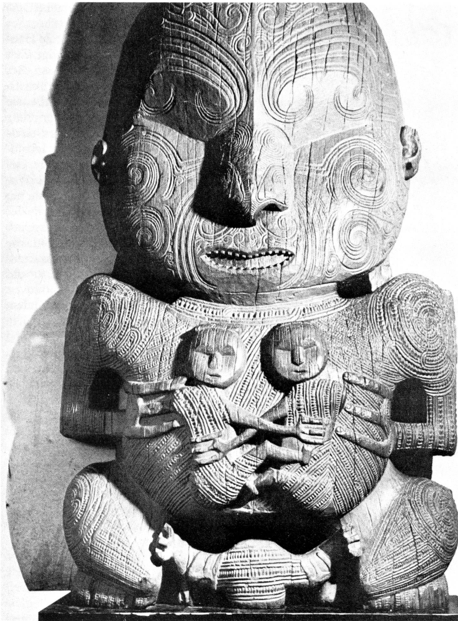
Monumentale Holzskulptur des Maori-Häuptlings Pukaki; Auckland-Museum, Neuseeland. Denken wir im Zusammenhang mit Entwicklungshilfe jeweils daran, dass Zivilisation nicht Kultur bedeutet, dass die Entwicklungsländer Anrecht auf Erhaltung und Pflege ihrer eigenen Kultur haben?

weise über eine oder mehrere Rekrutierungsstellen in Europa verfügen. Auch die Schweiz wäre durchaus in der Lage, für mehrere Länder gleichzeitig die Suche von Personal zu übernehmen, wobei dann der oder die Verantwortlichen der betreffenden Entwicklungsländer die definitive Rekrutierung vornehmen würden. Die normale Vertragsdauer eines Experten beträgt zwei Jahre. Das ist nicht lange genug. Welcher andere Arbeitgeber würde unbesorgt hinnehmen, dass ein neuer Angestellter mit der Idee, nicht länger als zwei Jahre zu bleiben, einsteigt? Und wenn der Arbeitgeber nur allzu gut weiss, dass sein