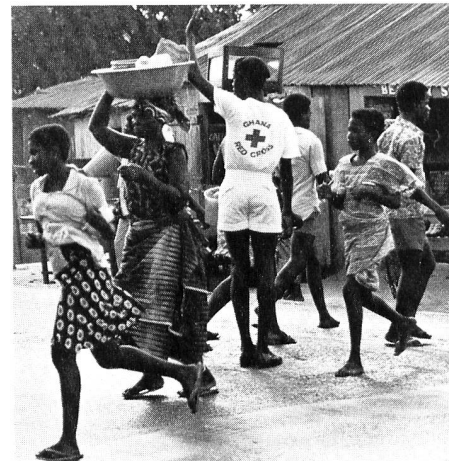
Ghana hat auf den Rechtsverkehr umgestellt: Freiwillige helfen bei der Verkehrsregelung.