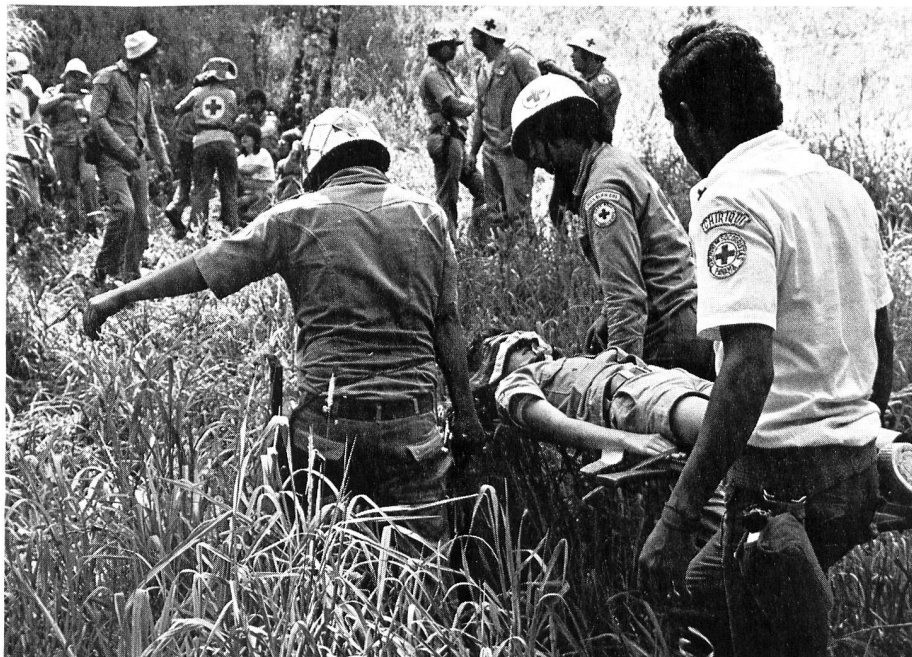
Feldübung «Vulkanausbruch» des Roten Kreuzes von Costa Rica.