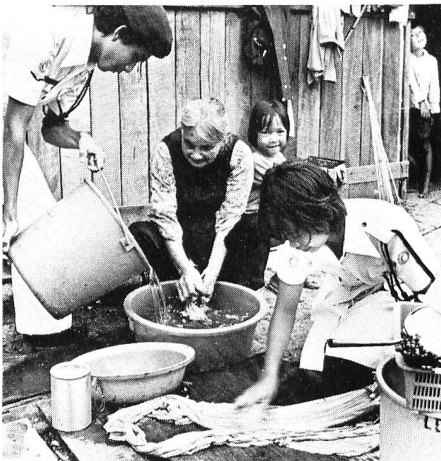
Freiwillige bei der Arbeit in einem malaisischen Flüchtlingslager.