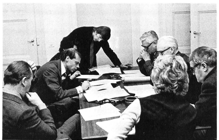
Die verschiedenen Räume eignen sich vorzüglich für Gruppenarbeiten und Kolloquien. Forschern und Studierenden steht eine umfassende Dokumentation zur Verfügung.