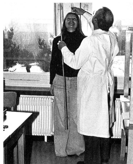
Hat die junge Schwester das «Mass», um eine RKD zu werden?

Information über den Sanitätsdienst der Armee fast immer sehr mühsam sei. Und für diejenigen, die über den Sinn und das Wesen des Rotkreuzdienstes unterrichten müssen, ist es oft genug nicht gerade etwas, wofür sie besonders motiviert sind. Weshalb ist das so? Liegt es am Stoff? Ist es eine Zeiterscheinung wie vieles andere auch und somit gleich entschuldigt? Ist es deshalb, weil man immer mehr persönliche Rechte fordert und durchsetzen will? Ist es deshalb, weil Pflichten gegenüber einer Gemeinschaft, wie der Staat eine ist, nicht mehr genügend wahrgenommen werden? Sind die persönlichen Freiheiten in unserem Lande soweit entwickelt, dass die Wohlfahrt, was immer das auch ist, vergessen macht, Pflichten zu übernehmen, die der Staatsgemeinschaft dienen? Ist das eine Folge des lange Zeit und immer noch vielfach gerühmten Pluralismus, der vor der Einheit des Menschen auch nicht halt macht und so das Individuum zu zerreissen droht in eine unüberschaubare Vielheit?