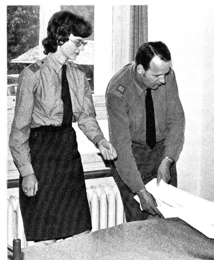
Schon in Friedenszeiten ist die RKD-Schwester unentbehrlich für die Instruktion der Sanitätssoldaten.