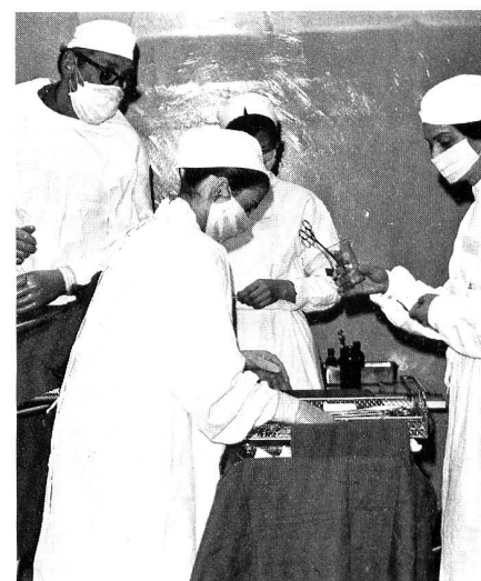
In Übungen und Kursen macht sich die RKD mit der Ausübung der Krankenpflege unter Kriegsbedingungen vertraut.