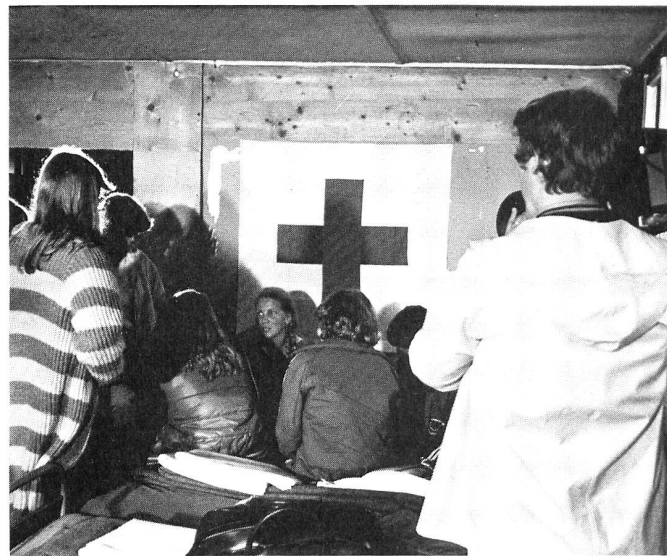
Die ersten Stunden im Lenker Lager im Scheinwerferlicht.