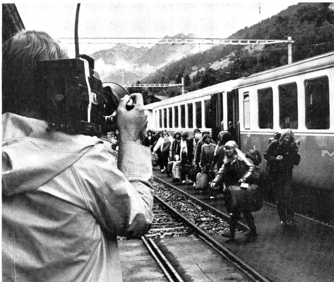
In Lenk am 24. Juli.