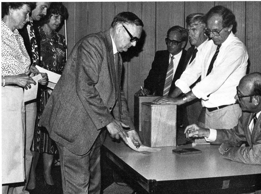
Urnenabstimmung, eine Seltenheit beim SRK. Weil für das Präsidium zwei Kandidaten vorgeschlagen waren, musste statutengemäss geheime Wahl durchgeführt werden. Bei den übrigen Geschäften wurde offen abgestimmt.

Dass es sich hier um ein heisses Eisen handelt und die Zentralorganisation mit den regionalen Sektionen aufgrund ihrer teilweise unterschiedlichen Aufgaben immer wieder in Konkurrenz gerät, zeigte sich an der Delegiertenversammlung in zwei Anträgen der Sektionen, die nach eingehender