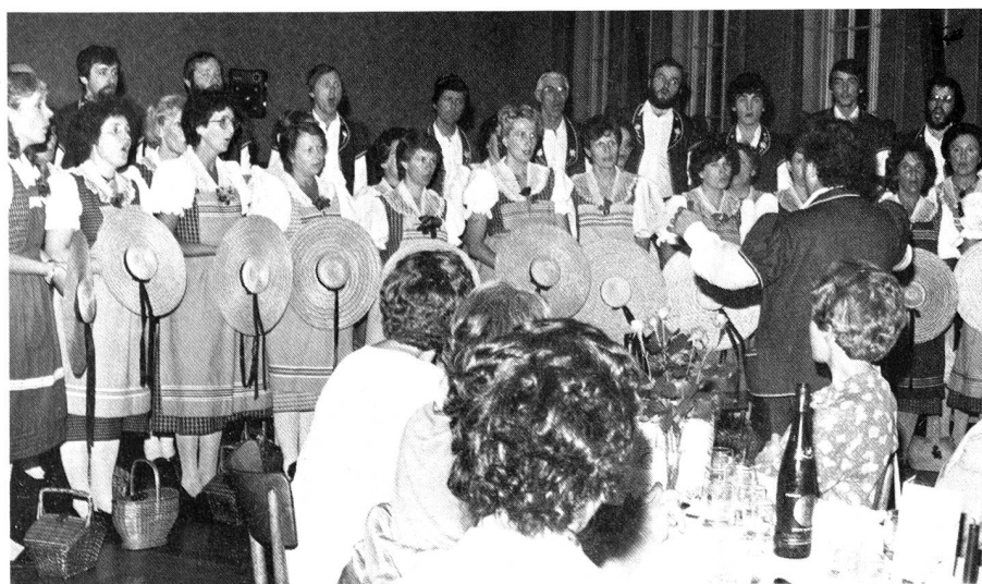
Zur guten Stimmung am Samstagabend trug auch ein Freiburger Trachtenchor bei.