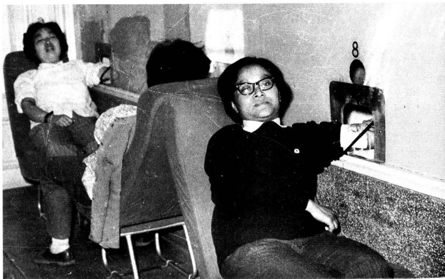
Im Blutspendezentrum. Die Entnahme spielt sich «hinter den Kulissen» ab.

Das System des Einheitslohns scheint allerdings nicht so ganz sakrosankt zu sein: In der landwirtschaftlichen Produktionskommune Zu den vier Jahreszeiten sprach man uns von einem abgestuften Leistungslohn, der bis zu 130 Yüan steigen könne.