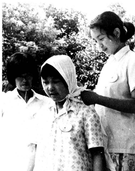
Kinder lernen Erste Hilfe.

In der Nähe von Kanton besichtigten wir eine landwirtschaftliche Siedlung, wo auf etwa 1000 ha Land gegen 5000 Heimkehrer leben. Die Hälfte von ihnen kamen aus dem Raum Indochina-Indonesien, die andere Hälfte sind Flüchtlinge aus Vietnam. Die Siedlung, die 13 Produktionsgruppen – neben landwirtschaftlichen Betrieben auch Werkstätten – umfasst, ist autonom und wird von den Einwohnern selber verwaltet. Es gibt 13 Primarschulen und eine Sekundarschule, und jedes «Dorf» hat sein Dispensarium, das von einer Krankenschwester geleitet wird. Für den ganzen Komplex steht ein Spital mit 40 Betten zur Verfügung.