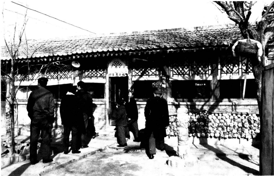
Bauernhaus in der Kommune Zu den vier Jahreszeiten. Jede Familie bekommt Land zugeteilt und baut das Haus mit Hilfe von Nachbarn selber. Im Hof oder auf der Strasse wird oft eigenes Kleinvieh gehalten.

Einfach ist das Leben auch auf den Werkplätzen. Das meiste ist Handarbeit, und Hände gibt es ja in China an die zwei Milliarden. Auf den Feldern haben wir keinen einzigen Traktor gesehen und auf den Strassen keine Baumaschinen. Dafür ist jeder Quadratmeter Ackerland bis weit in die Berge hinauf sorgfältig bebaut.