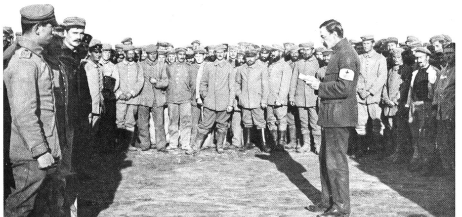
IKRK-Delegierter bei Kriegsgefangenen in Marokko, 1917, als es noch gar keine Konvention zum Schutz der Kriegsgefangenen gab.

Bekanntlich wurde das Rote Kreuz zur Unterstützung der Armeesanität bei kriegerischen Auseinandersetzungen ins Leben gerufen, da sich gezeigt hatte, dass die bisherigen Mittel zur Versorgung der im Felde verwundeten oder der von Epidemien ergriffenen Soldaten nicht ausreichten. Diese