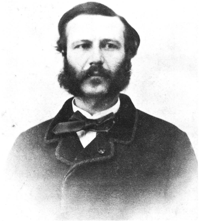
Henry Dunant, um 1863.

Vom 26. bis 29. Oktober 1863 tagte in Genf jene von Henry Dunant angelegte internationale Konferenz, welche die Gründung von nationalen Gesellschaften zur Unterstützung des Armeesanitätsdienstes im Kriegsfall empfahl und damit das Rote Kreuz ins Leben rief. Sie war Auslöser für die ein Jahr danach vom Schweizerischen Bundesrat einberufene diplomatische Konferenz, an der die erste Genfer Konvention abgeschlossen und das rote Kreuz im weissen Feld als Schutzzeichen angenommen wurde.