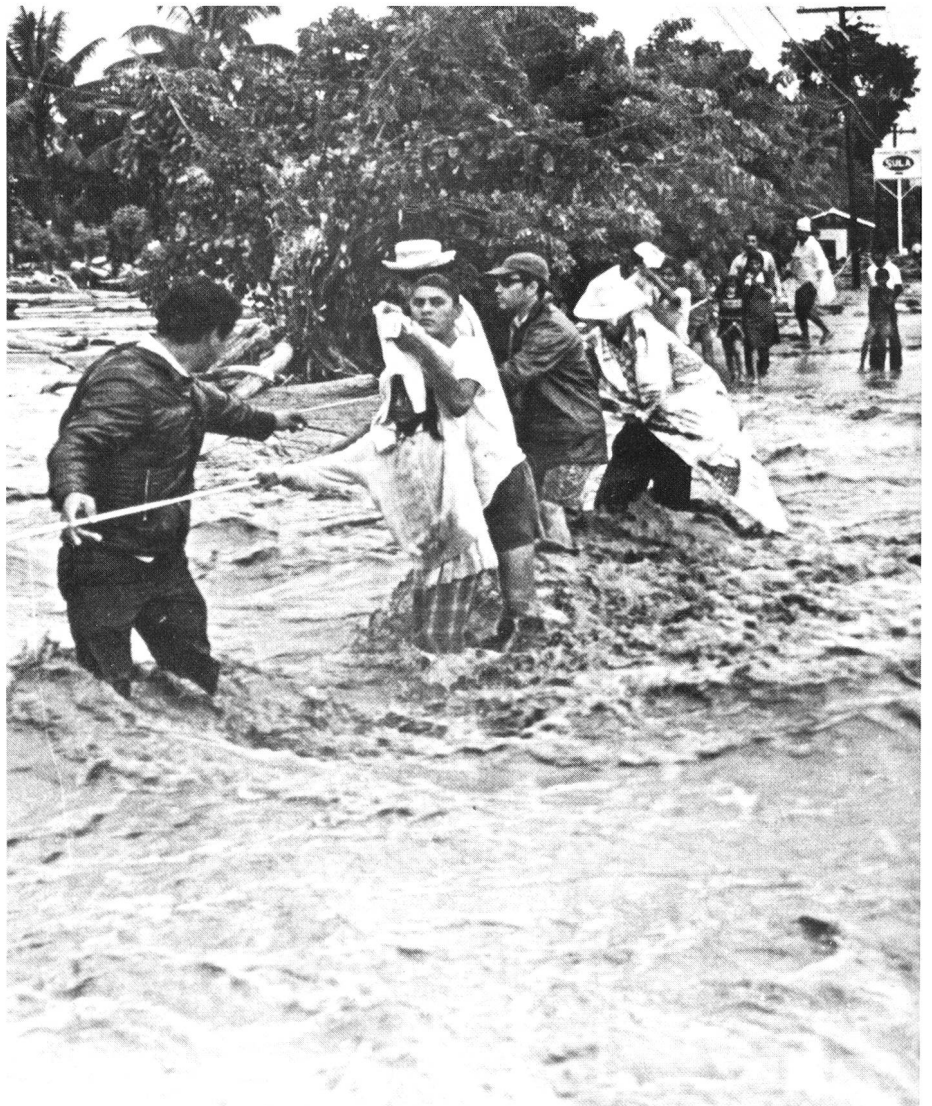
Freiwillige des Honduranischen Roten Kreuzes helfen nach einem Wirbelsturm den Obdachlosen ein Notzentrum zu erreichen.

Die nationalen Rotkreuz-Gesellschaften sind alle auch angehalten, die Behörden bei den Tätigkeiten zum Wohl der Allgemeinheit zu unterstützen. Daraus mag da und dort eine gewisse Einengung der eigenen Handlungsfreiheit erwachsen, andererseits sind die Rotkreuzorganisationen mit ihren bedeutenden unentgeltlichen Leistungen für den Staat unentbehrlich und ihre Ausrichtung auf das Prinzip «Menschlichkeit» wirkt auf den Partner zurück. □