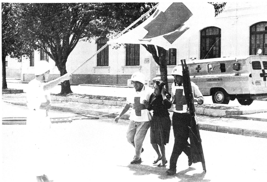
Unter dem Schutz der Rotkreuzfahne werden Zivilisten aus dem besetzten Regierungsgebäude von Managua herausgeführt.