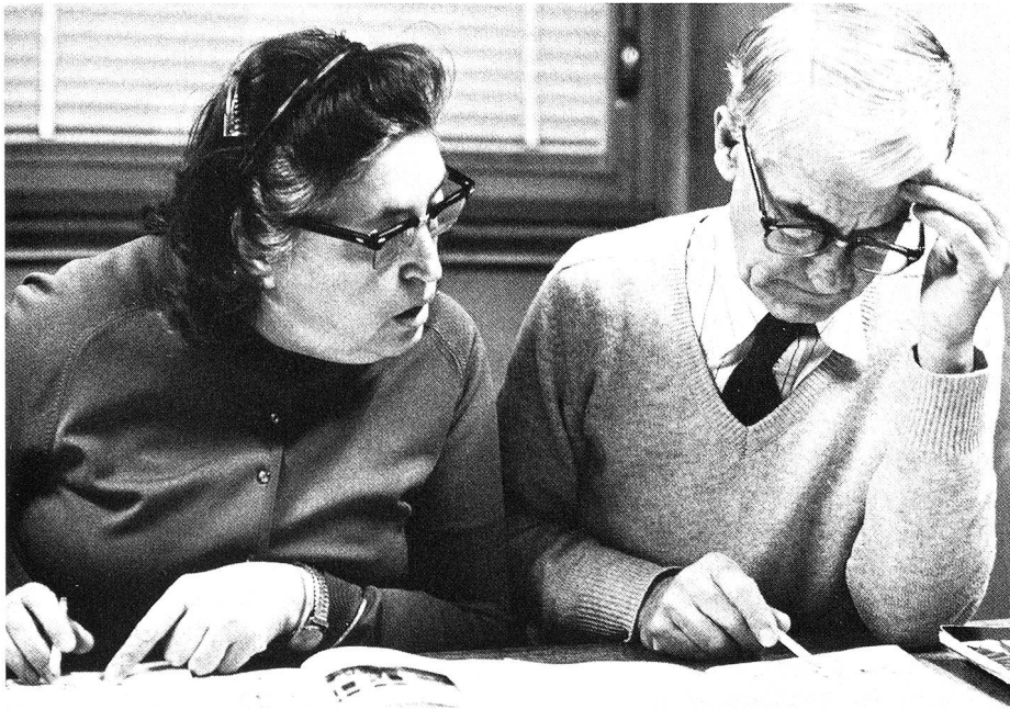
Für die ältere Generation ist der Neuanfang im Exil oft besonders schwer.

rechtlich den Status des bestgestellten Ausländers erhalten soll. Effektiv in dem Sinne, dass ein Dauerasyll nicht nur ein Anwesenheitsrecht, sondern auch eine Existenzmöglichkeit bieten soll. Das bedeutet einerseits, dass für diejenigen, die unverschuldet bedürftig und erwerbsunfähig sind, gesorgt werden muss und andererseits, dass diejenigen, die arbeitsfähig sind, das Recht haben, ihren Unterhalt durch Arbeit zu verdienen.»