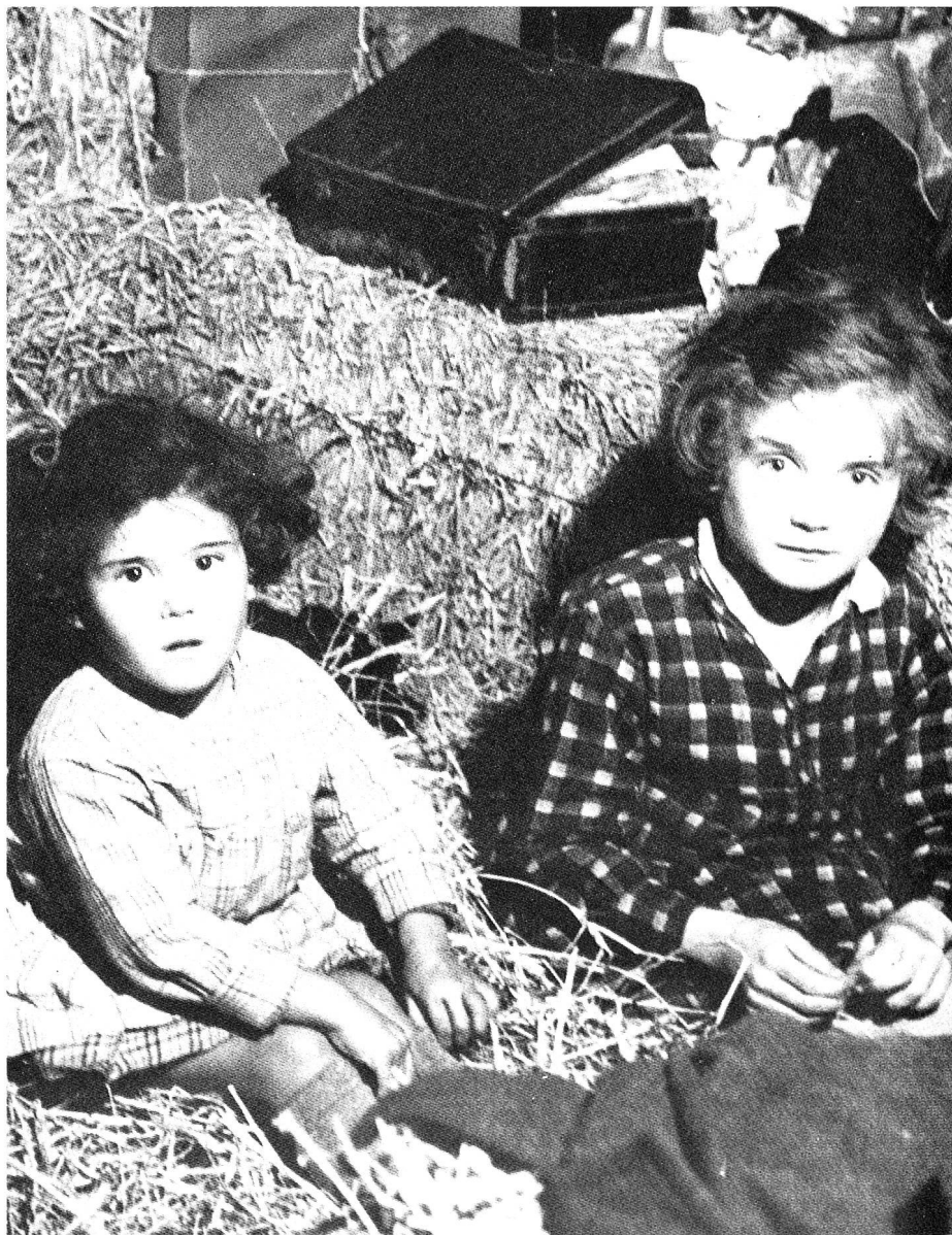
Zweiter Weltkrieg: Franzosenkinder haben in einer Scheune vorübergehend Zuflucht gefunden.

während des Zweiten Weltkrieges eine grosse Arbeit geleistet hatten. Die Überlegungen, die der damalige Vertreter der Zentralstelle für Flüchtlingshilfe, Dr. R. Meyer, zur Bedeutung des Dauerasyls formulierte, sind noch heute aktuell: Durch die Asylgewährung könne die Schweiz innerhalb ihrer eigenen Grenzen einen dauerhaften Beitrag zur Lösung eines grossen, internationalen Problems leisten. Sie müsse sich dabei vom Grundsatz leiten lassen, dass das Asyl dauernd, würdig und effektiv sein soll: «Dauernd, weil es dem Flüchtling die verlorene Heimat ersetzen und ihm gestatten soll, seine Zukunft zu planen und zu gestalten, frei von der Furcht, seine Wanderschaft fortsetzen zu müssen. Würdig insofern, als der bei uns endgültig aufgenommene Flüchtling