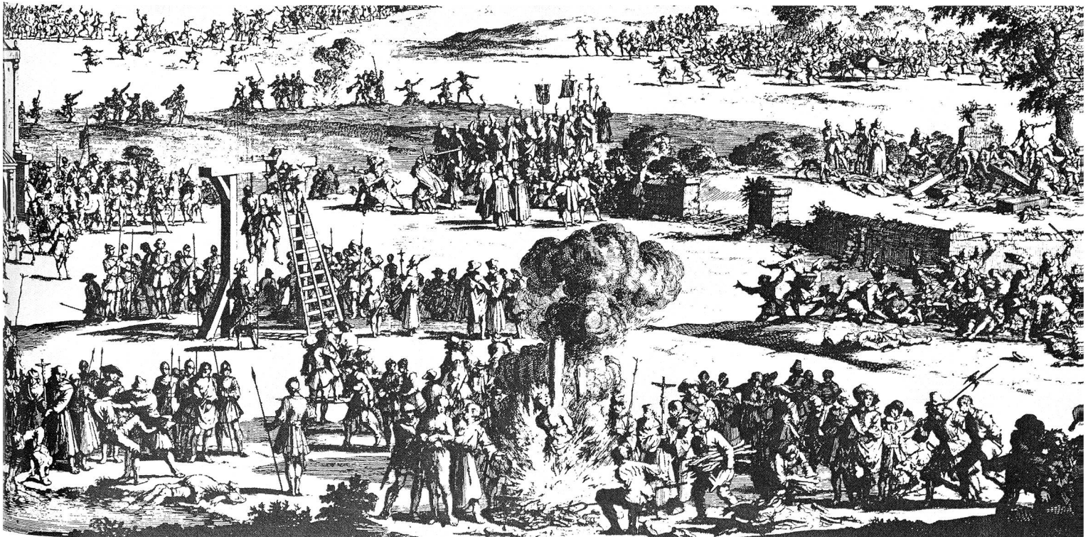
Religiöse Verfolgung in Europa in der 2. Hälfte des 17. Jahrhunderts (Jan Luyken, 1649–1712).

Das Ausland reagierte mehrmals verärgert auf die schweizerische Asylpolitik, der vorgeworfen wurde, sie fördere revolutionäre Umtriebe und sie biete Terroristen und Unruhestiftern Unterschlupf. Die Schweiz befand sich damals in einer ganz ähnlichen Lage wie heute viele Staaten der Dritten Welt, die Anhängern von Befreiungsbewegungen und Regimegegnern aus Nachbarländern Asyl gewähren. Die Heilige Allianz und später Bismarck übten massiven politischen