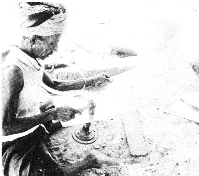
Aus Nomaden werden Gärtner. Mit einfachsten Methoden lernen sie unter anderem Giesskannen herzustellen.

Regierung davongetragen. Diese versucht, mit Bewässerungs- und Aufforstungsprojekten dem enormen Nahrungsmittelfizit und dem Fortschreiten des zerstörenden Wüstensandes beizukommen. Doch die Schwierigkeiten bei diesen Anstrengungen sind beträchtlich. Bei jeder Investition, die getätigt wird, und bei jedem Spatenstich, den ein Bauer ausführt, muss in Rechnung gestellt werden, dass der grösste Teil der Bemühungen in unproduktiver Verteidigungsarbeit gegen den tödlichen Sand gebunden wird. In solchen intensiven landwirtschaftlichen Projekten liegt dennoch die einzige Chance für die Bevölkerung, in Mauretanien auf ihrem Boden und in ihrer Heimat überleben und vielleicht sogar den eige-