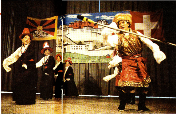
Kostüme und rituelle Tänze formen eine Harmonie von seltener Schönheit.

Ich stelle diese Frage einer Flüchtlingsbetreuerin des Schweizerischen Roten Kreuzes, und sie meint dazu: «Davon habe ich keine oder vielmehr sehr widersprüchliche Vorstellungen, in den letzten 25 Jahren hat sich gar manches ereignet. Tibeter in der Schweiz – das ist eine lange Geschichte! Sie sind uns dankbar, dass wir ihnen geholfen haben. Übrigens: dieses Fest beweist es!» In der Tat: alle bringen ihre Dankbarkeit zum Ausdruck, und in den zahlrei-