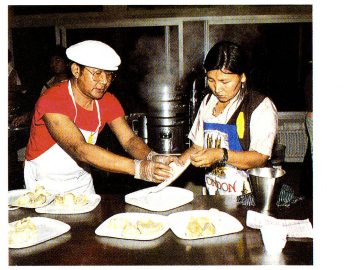
Selbst die Essenstradition hat sich fern von der Heimat erhalten. Hier entstehen «mormos», eine Art von riesigen, gefüllten Rivoli.

landschaften, diese Dörfer, die sich um ein Kloster drängen. Ob sie wohl Heimweh haben? Auf unsere Frage hin bleiben ihre Mienen undrückend. Werden sie ihre Bräuche, ihre Traditionen, ihre Religion bewahren können? Die Frage ist berechtigt. Heutzutage gibt es in der Ostschweiz, wo fast alle Schweizer Exiltibeter leben, genauer gesagt in Rikon,