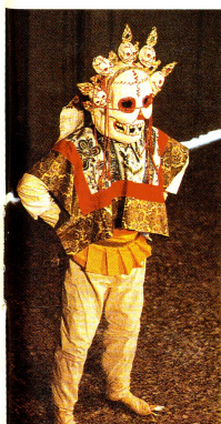
Der Dhrutoo Daggio, eine Figur aus dem Totenreich, spielt im tibetischen Theater eine der symbolträchtigen Rollen.