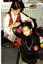
Der Zauber, der von den Tibetern ausgeht, zieht uns nicht nur Schweizer unwiderstehlich an.

Religion zu gewährleisten, und schliesslich wollte man die jungen Generationen erziehen. Schon Ende der fünfziger Jahre begaben sich Schweizer nach Indien, um dort Gruppen von emigrationswilligen Tibetern zu sammeln, diese reisten nacheinander in die Schweiz ein, wobei man vor allem darauf achtete, dass die Mitglieder einer Familie zusammenbleiben konnten bzw. sie erneut zusammenzuführen. In der Schweiz wurden sie in Heimen untergebracht, bis sie selbstständig genug waren, um sich in unserer Gesellschaft einen Platz zu schaffen.