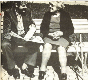
...als Mann sich für eine ältere Zeitgenossin Müsse für eine Plauderei zu nehmen...