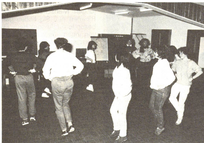
Sichkennenlernen bei Tanz und Rollenspielen.

derhalb Tage dauerte, erlebten Jugendliche zum Beispiel Krisensituationen, wie sie zum Alltag des Roten Kreuzes gehören. Dabei wurden die Jugendlichen in Gruppen, analog der Organisation des Roten Kreuzes, aufgeteilt und hatten nun konkrete Fälle zu bewältigen, wie beispielsweise Erdbeben in der Türkei, Unwetter in der Schweiz, Hungernde in 20 Ländern Afrikas.