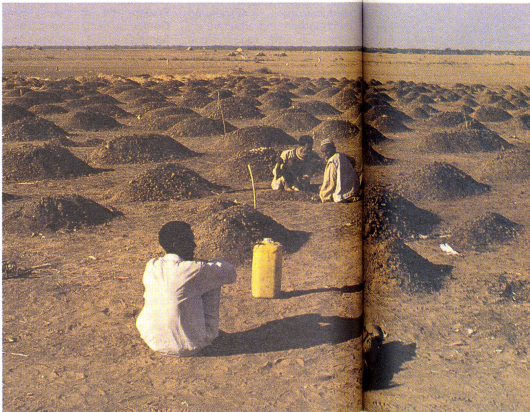
Gräber – ein Hügel am andern – Frauen und Männer die keine Tränen mehr haben, wenn sie die eigenen Kinder begraben müssen.

auf die Stellung zu den Kindern und zu den alten Leuten in unserer Gesellschaft und jener im Sudan.