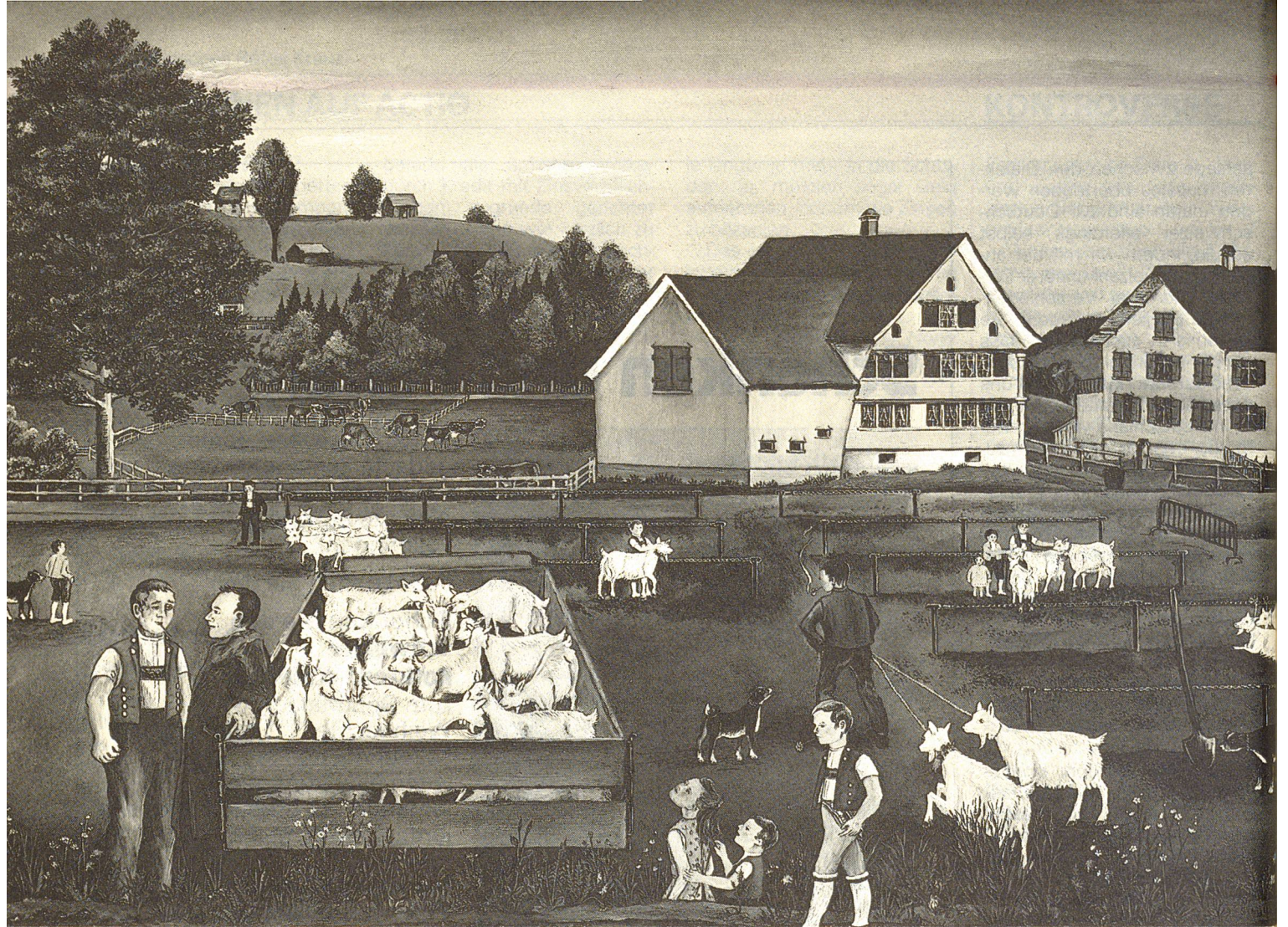
Bilder, die ganze Geschichten erzählen.