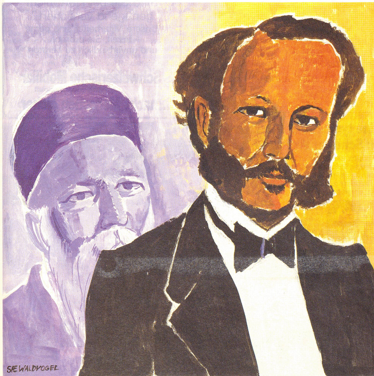
Henry Dunant