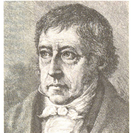
Die Cholera tötete den Philosophen Hegel...

... und den preussischen Heerführer Karl von Clausewitz.