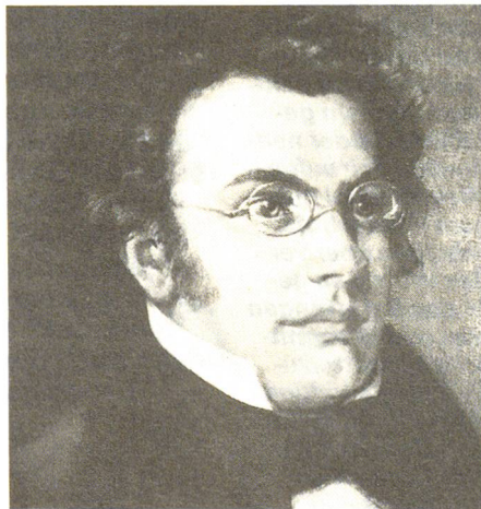
Franz Schubert, 31, wurde Opfer der Syphilis.

Im Alter von 59 Jahren verstarb am 2. Oktober 1985 in Hollywood der Filmstar Rock Hudson. Der 1,94 m grosse, unbesiegbare (Frauen-)Held spielte in rund 60 Filmen und in unzähligen Fernsehserien. Erst zwei Monate vor seinem Tod bekannte er sich zu seiner Homosexualität und zu seiner unheilbaren AIDS-Erkrankung. Sein Vermögen von rund 45 Mio. Dollar vermachte er der AIDS-Forschung.