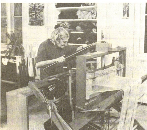
Eine Patientin hat hier Heimrecht erworben. An ihrem schönen Webstuhl fertigt sie Meisterstücke.