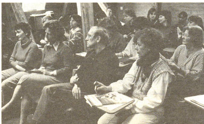
Das Schindlergut ist nicht nur Sitz der Sektion, sondern auch Tagesheim, Therapie- und Kurszentrum.