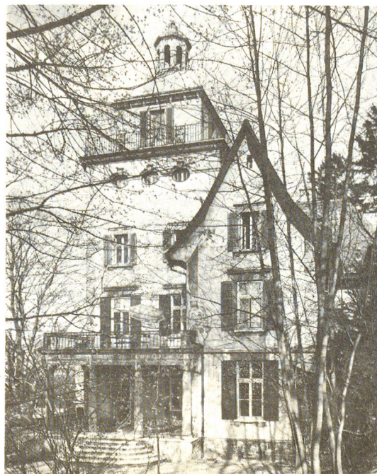
Das Haus an der Kronenstrasse 10 in Zürich, das ehemalige Schindlergut, ist vom Keller bis unters Dach mit Leben angefüllt.

Für 1986 plant man im Schindlergut eine Informations- und Motivationswoche «Hilfe 86». Vom Keller bis hinauf zum Turmzimmer soll alles in eine einzige Ausstellung verwandelt werden. Mit Medienräumen, Ausstellungen, Diskussionen, Veranstaltungen sollen hier einer breiten Öffentlichkeit, vor allem aber den Jugendlichen im Berufswahlalter, die Berufe im Gesundheitswesen anschaulich und erlebnisreich näher gebracht werden. □