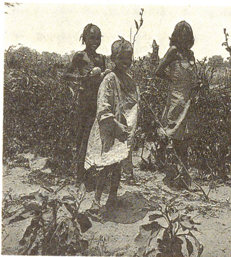
Kleine Gartenbauprojekte ermöglichen einen Wiederanfang. Hungerflüchtlinge stehen vor ihrer ersten Ernte von Gemüse, Kartoffeln und Mais.

Auch wenn alles so alltäglich aussieht, die langfristig gesicherte Nahrungsmittelhilfe durch das Rote Kreuz hat die Bewohner des Dorfes verändert. Ich spüre deutlich die Erwartungshaltung: Rotes Kreuz, gib! Ich versuche nicht zu argumentieren, denn vieles versteht sich in diesen Dorfgemeinschaften schliesslich von selbst, ohne dass es direkt ausgesprochen wird. Die Nahrungsmittelhilfe ist ein fester Bestandteil des täglichen Lebens geworden.