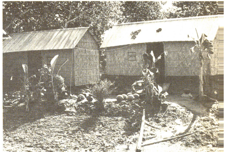
Bereits bewohnte Häuser des letztjährigen Wiederaufbauprogramms.

Der ganze Süden von Bangladesh ist ein riesiges Delta des Ganges und Brahmaputras. Vor allem in der Regenzeit schleppen die über 10 km breiten Flüsse Tonnen von Sand und anderes Geschiebe mit sich und lagern es ab. Fruchtbare Schwemmböden entstehen. Gleichzeitig versanden die Flussbetten, was dazu führt, dass die Ströme sich neue Wege durch bereits bewohntes Land bahnen. Nach Regierungsuntersuchungen erodierten allein von der