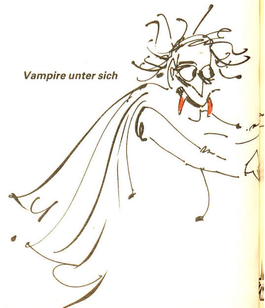
Vampire unter sich