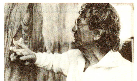
29 Panta Rhei – Alles fliesst Künstlerporträt Hans Erni